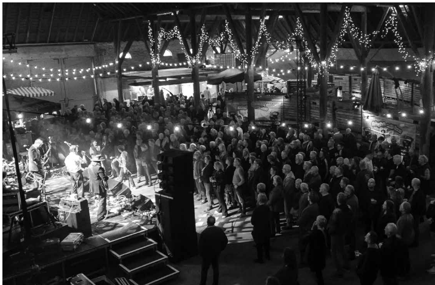
▼ De locatie had een echte festivalsfeer