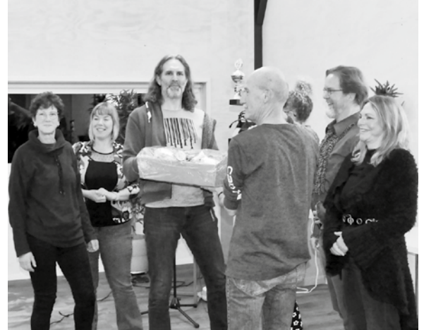
Team De Grasduiners