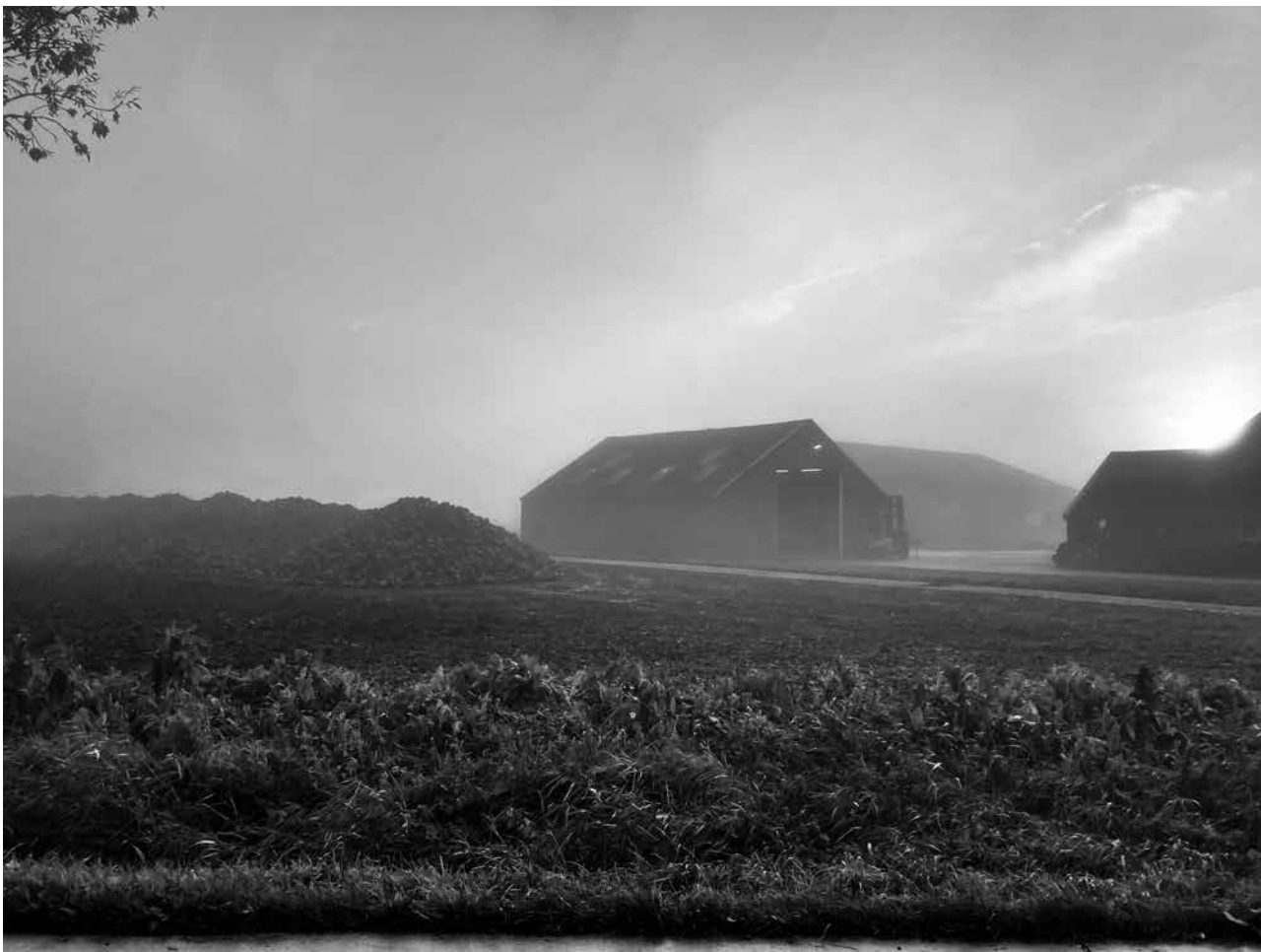
Sukkerbaiten in dook