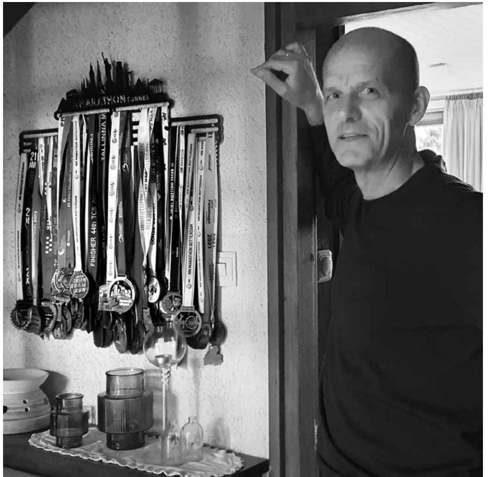
Als bezoeker niet te missen in de hal bij Stoffer thuis: de medailles als aandenken aan de zestig volbrachte marathons

Wat bezielt iemand om zich gedurende zo'n vier à vijf uur te vermoeden? Stoffer: 'Het is gegroeid van rondjes van 4 kilometer naar rondes van 21 kilometer en uiteindelijk naar de marathon. Bij alle afstanden is het een kwestie van de knop omdraaien, luisteren naar je lichaam en het doseren van kracht en energie. Het is een bepaald denkpatroon waarbij ik de loop in stukjes knip. Na 21 kilometer begint het terugtellen en na 30 kilometer begin ik het rondje Klunder te visualiseren. Nog drie rondjes Klunder en dan ben ik er. Uitlopen en heel blijven is mijn devies. Het gaat mij daarbij