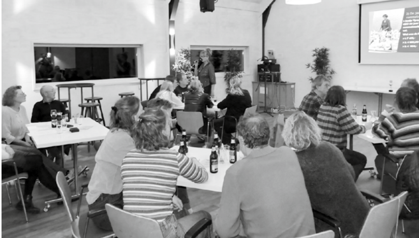
Hier komt het aan op echte kennis: gebruik van mobieltjes is niet toegestaan

Activiteitencommissie Dorpshuis de Leeuw