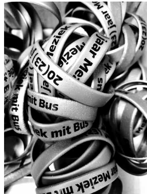
▲ Bij een speciale editie hoort een speciaal polsbandje