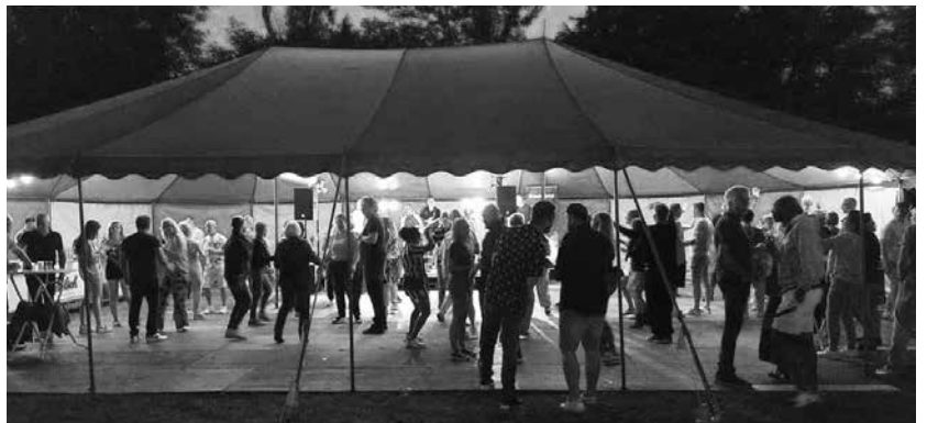
Het was een gezellige boel in Ruischerbrug