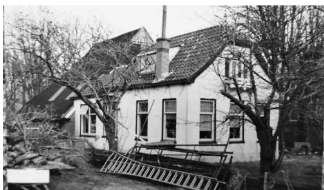
▲ Dorpsweg 46, jaren 90 Dorpsweg 46, 2022 ►