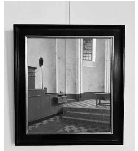
Helmantels uitbeelding van het koor van de Kloosterkerk