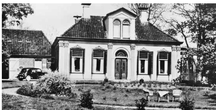
▲ Dorpsweg 8 'doktershuis', 1956 Dorpsweg 8 'doktershuis', 2022 ►