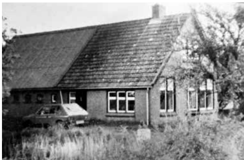
▲ Grasdijkweg 25, 2004 Grasdijkweg 25, 2022 ►

Henk Vliem, namens de Historische Commissie Garmerwolde