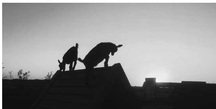
Jonge geitjes in de avondzon bij de familie Verbree