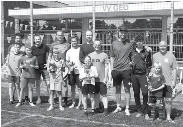
Alle prijswinnaars en de beide keepers van de ouder-kind-penaltybokaal

Ook de jeugdteams zijn weer ingeschreven. Helaas houdt het voor de JO-15 op. (JO is jongeren, red.) Door de sprong van JO-15 naar JO-17 (JO-16 is er niet op ons niveau) waren er te weinig spelers. Hopelijk zien wij de spelers over drie tot vier jaar terug als ze zijn opgegroeid tot senior. Daarentegen gaan wij het nieuwe seizoen wel in met een jeugdteam meer dan afgelopen seizoen. Naast drie JO-teams zal er sinds lange tijd ook weer een MO-15 (meiden) team ingeschreven worden. Onze meiden hebben hun eerste oefenwedstrijd zeer verdienstelijk gespeeld. Helaas was de tegenstander nog een maatje te groot, maar voor een eerste wedstrijd op een groot veld ging het prima.