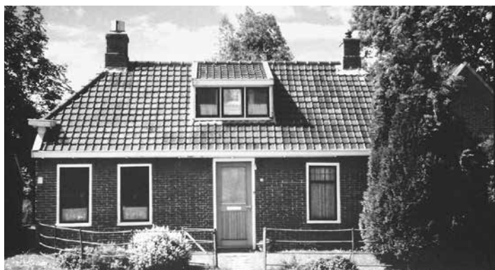
▲ Dorpsweg 17, jaren 80 Dorpsweg 17, 2022 ►