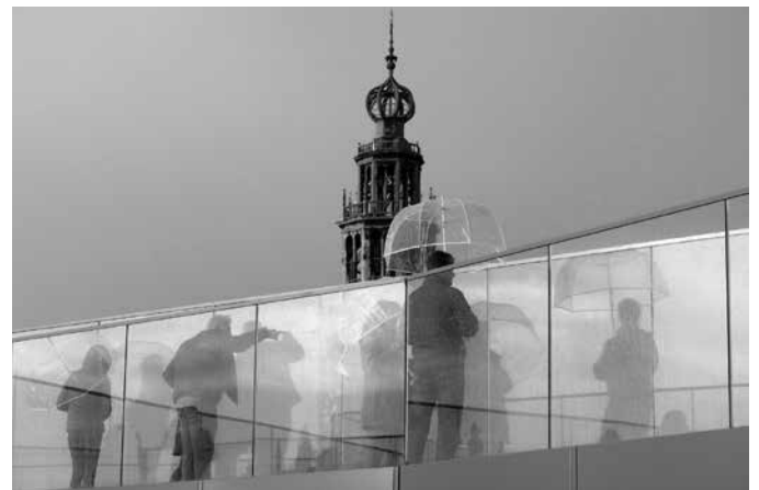
Ton Ensing

De expositie is geopend van 10.00 tot 17.00 uur. U bent van harte welkom. Leden van de fotogroep zijn zelf aanwezig voor het beantwoorden van vragen en opmerkingen. Meer informatie is te vinden op fotogroepgarmerwolde.com .