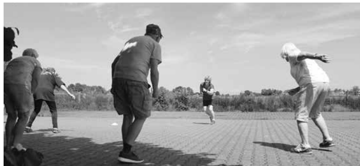
Fijn weer buiten bewegen!

In Garmerwolde zijn we vorig voorjaar ook met een groep senioren sport begonnen, maar daar was de mogelijkheid om buiten te sporten niet ide-