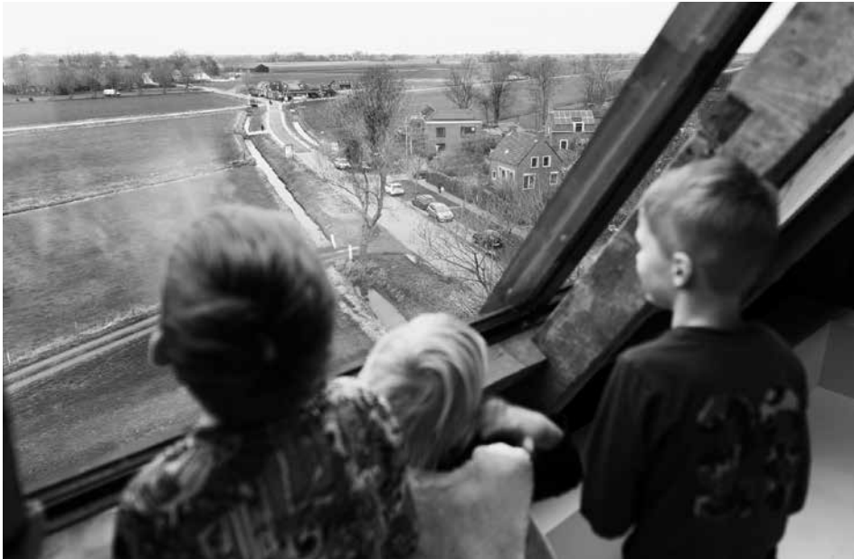
Uitzicht vanuit de toren. Opening toren 28 februari 2018

maatschappij door het gebouw in gebruik te houden en het een nieuwe bestemming te geven.'