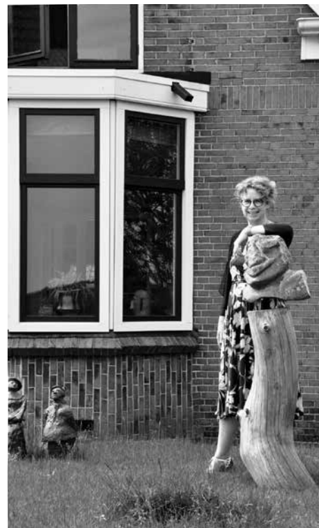
Victoria met beelden

Victoria had gehoord dat Garmerwolde een actief dorp is, maar daar is vanwege de corona nog niet veel van te merken. Ze is echter al wel actief geweest tijdens de klusdag van eind mei;