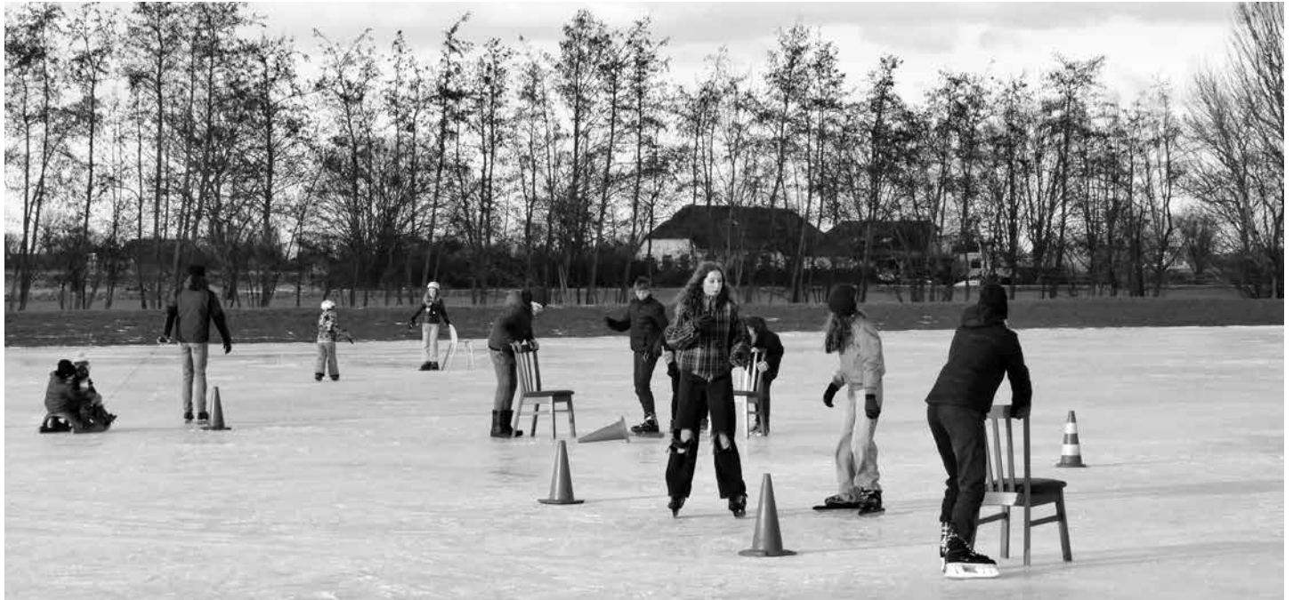
Oefenen en spelen op de ijsbaan