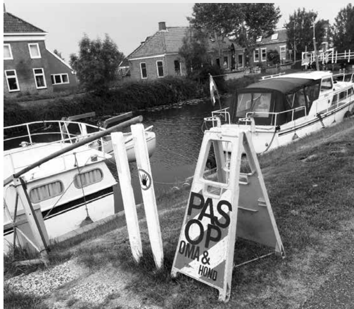
De boot van oma Tonnie