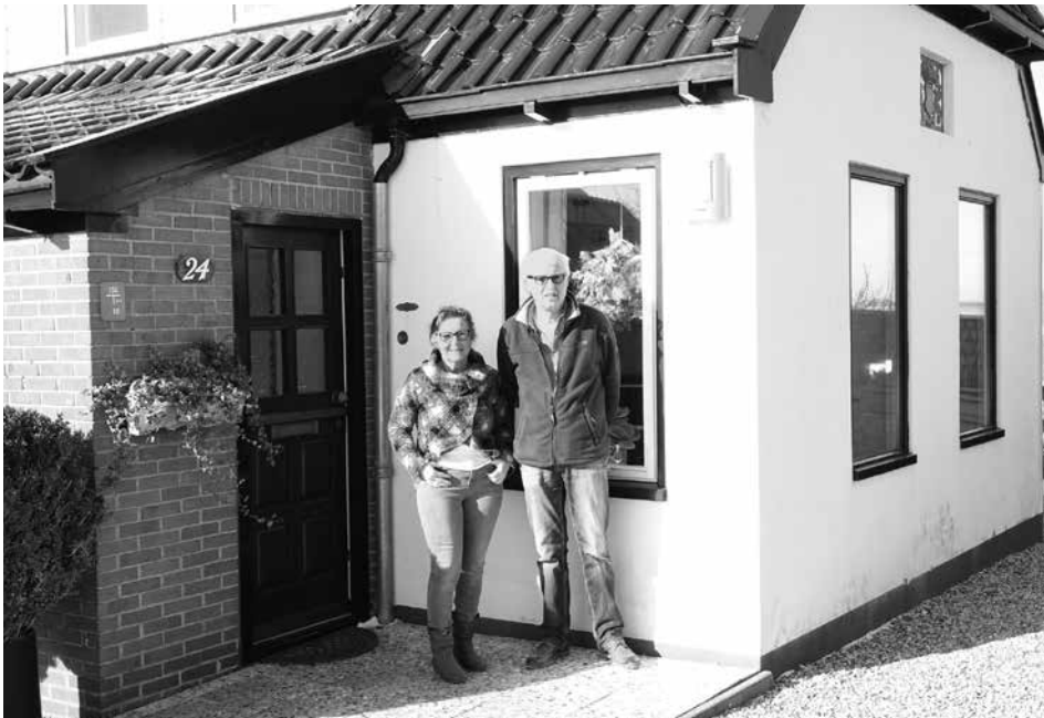
... en nu