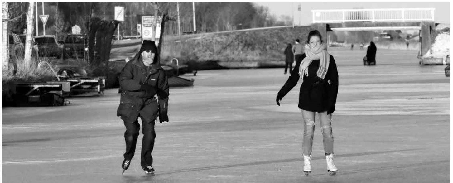
Zwieren op het Damsterdiep