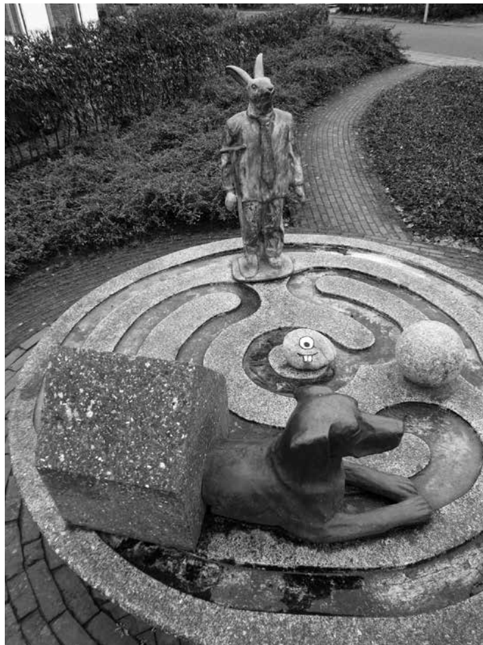
Kunstwerk 'Stad en Lande' gemaakt door Nicolas Dings

Waar staat het kunstwerk dan precies voor? De maker van 'Stad en Lande', Nicolas Dings, wilde met het kunstwerk het volgende verbeelden: 'Garmerwolde vormt de overgang tussen stad en ommeland; de bakstenen verhoging is een terp en de donkergrijze schaal daarvan het spiegelbeeld. Daarin ontvouwt zich de open dorpsgemeenschap, waardoor het meanderende Damsterdiep stroomt. De hond staat symbool voor waakzaamheid, voor het behoud van waarden terwijl de economie