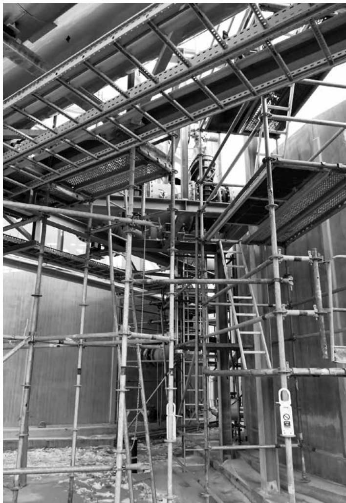
Leidingwerk van de industriewaterzuivering in de steigers