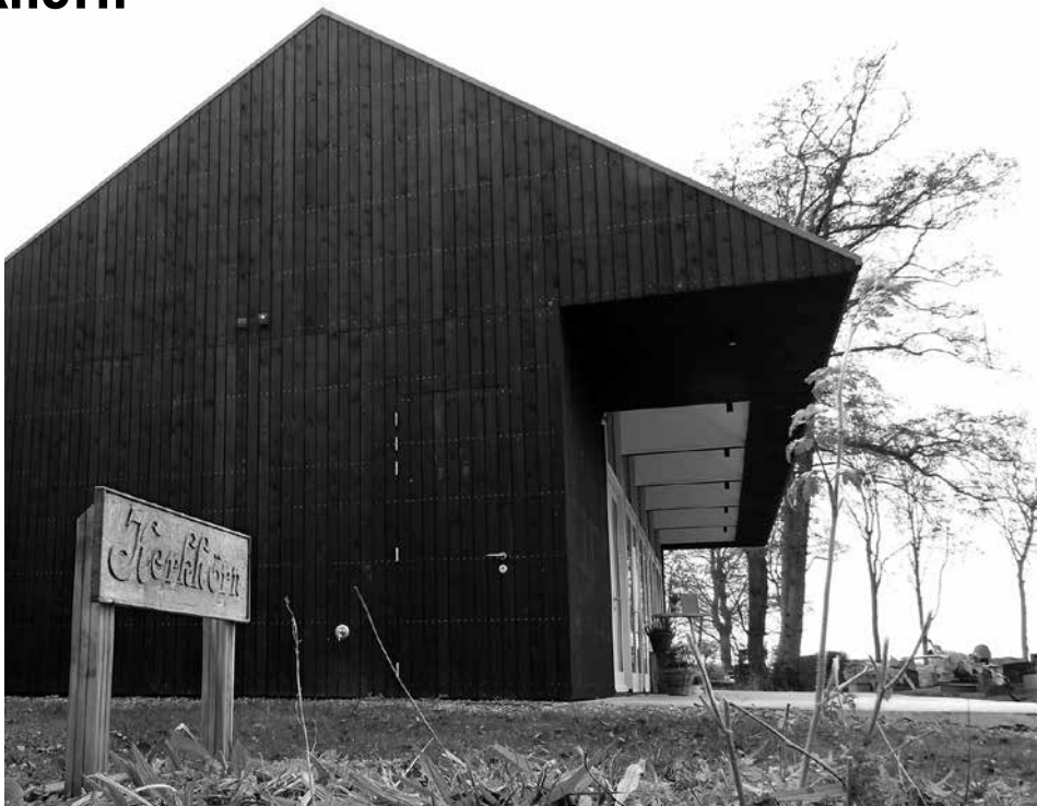
Of het bord straks schuilgaat achter de bloemen, we zullen het zien. Maar de naam Kerkhörn blijft zo toch bewaard