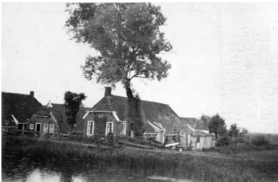
Het huis van de familie Ridder vroeger ...

Bert: 'Mijn vader Henderikus kon mooi vertellen over het ophalen van de 'schietemmers'. Het verhaal dat hij een tonnetje wilde pakken en vanuit het huisje een stem hoorde: 'eem wachten