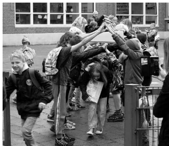
Er was dan wel geen eindmusical, maar de schoolverlaters werden wel uitgezwaaid door hun schoolgenoten