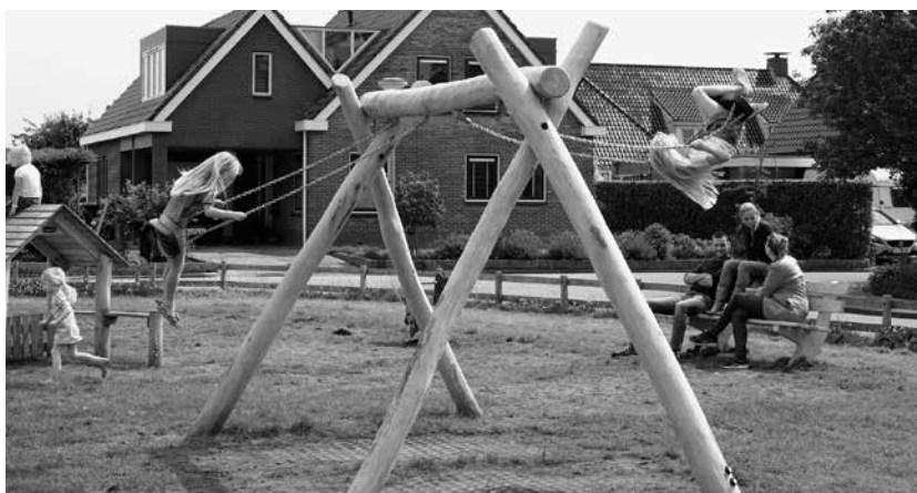
Er is een nieuwe speeltuin gekomen op het speelveldje van de Molenhorn in Thesinge (zie ook de G&T van juni). En daar wordt al druk gebruik van gemaakt, door zowel de jeugd, als ook door de ouders, die een oogje op hun spelende kroost houden en gelijktijdig lekker bijkletsen.