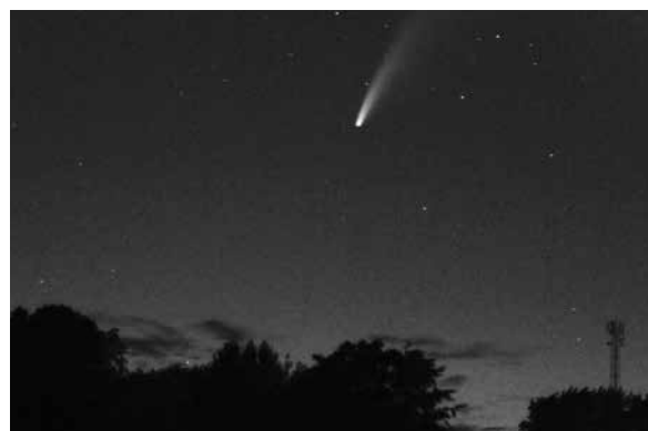
Afgelopen 11 juli maakte Lasse deze foto van de komeet Neowise. Hij had in de krant gelezen dat de komeet te zien zou zijn en zat twee nachten van 00.00 tot 02.00 uur in de achtertuin te kijken. Met zijn nieuwe grote lens, waarmee hij heel goed kon inzoomen, en 25 seconden sluitertijd maakte hij dit fantastische plaatje.