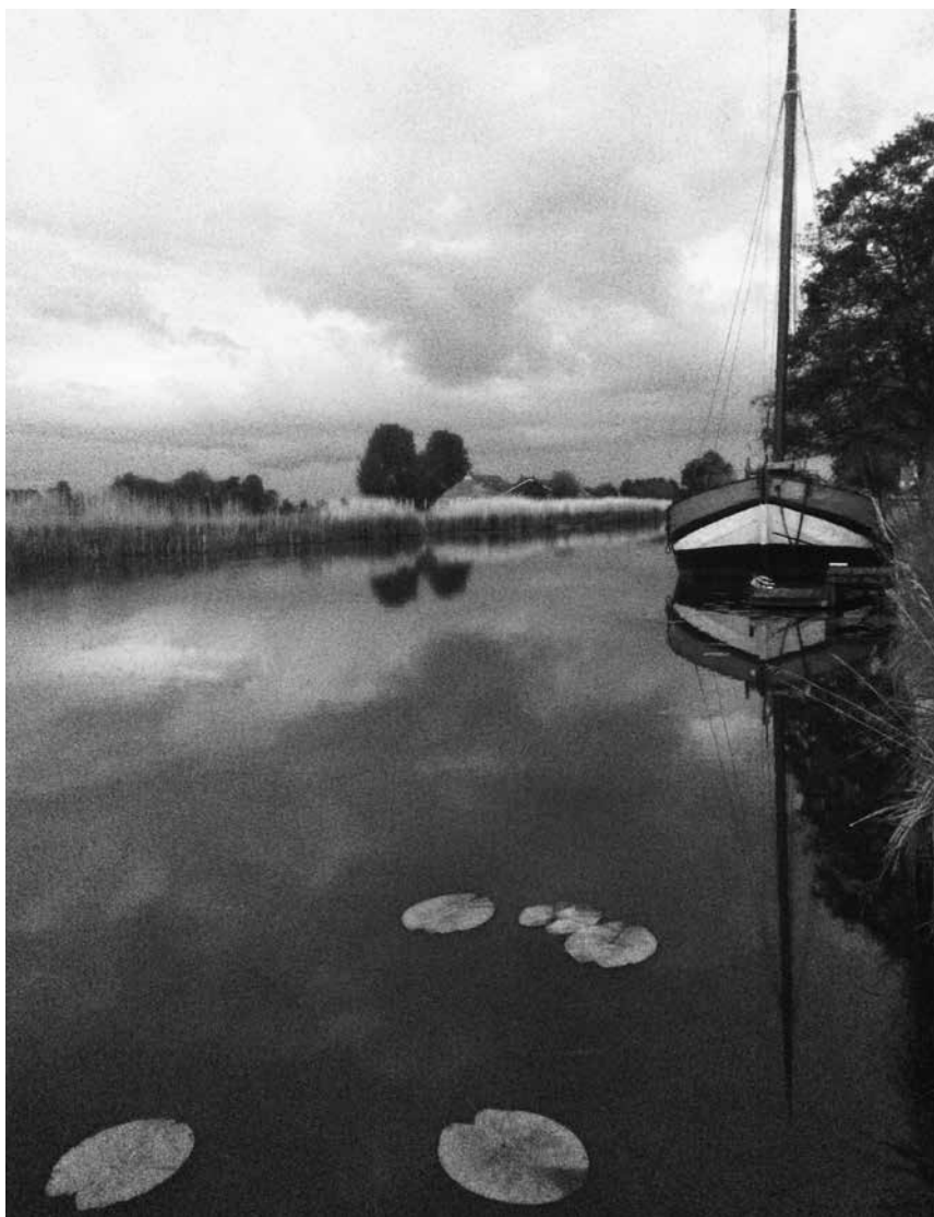
Stille wateren in Garmerwolde