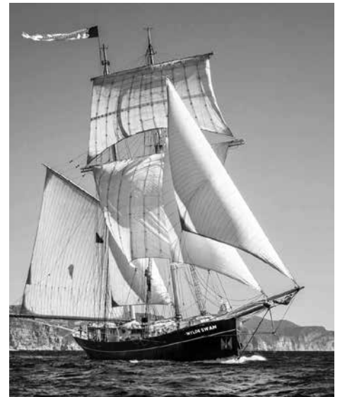
De Wylde Swan in vol ornaat