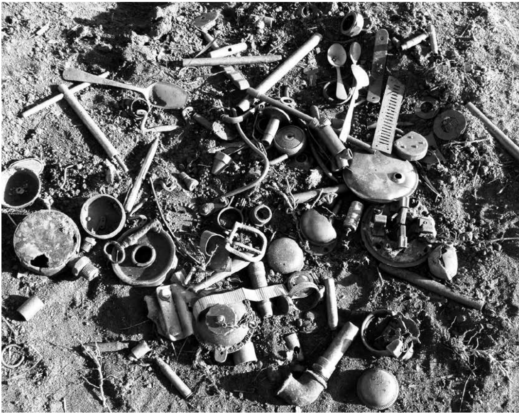
Een verzameling van klein spul dat uit het slibdepot bij het Damsterdiep gevist is