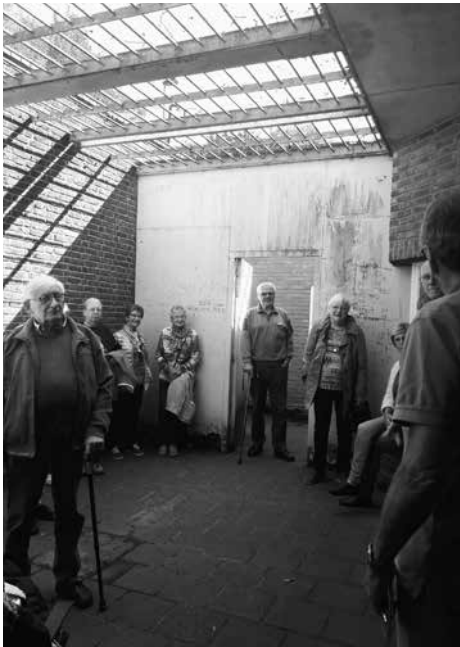
Luchtplaats in de Rode Pannen

We beginnen om 14.30 uur en natuurlijk is iedereen weer van harte welkom.