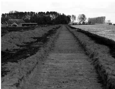
Het nieuwe fietspad over de Eemskanaaldijk is al uitgegraven

Het recreatieve fietspad wordt 1,5 meter breed. Veel materiaal wordt over het water verplaatst. Er komt eerst nog zand in; dit zal gebeuren met