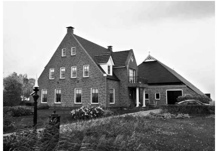
De woning met schuur anno 2018, het uilenbord is duidelijk herkenbaar

Sinds 1989 wonen Piet en Vera van Zanten aan de Geweideweg in Garmerwolde, op de boerderij waar Piet is opgegroeid. Voor die tijd huurden zij de boerderij van Pelleboer aan de Dorpsweg, hun eerste woning na hun trouwen 'op een mooi plekje in het dorp'. Piet wilde al lang boer worden, maar vader Van Zanten vond het nog niet nodig met het bedrijf te stoppen. Pas in 1987 was vader zo ver dat het bedrijf aan de Geweideweg kon worden overgenomen. Zijn ouders hadden de boerderij altijd goed onderhouden, maar geen grote verbouwingen uitgevoerd. Dat was dan ook het eerste dat door Piet en Vera werd opgepakt.