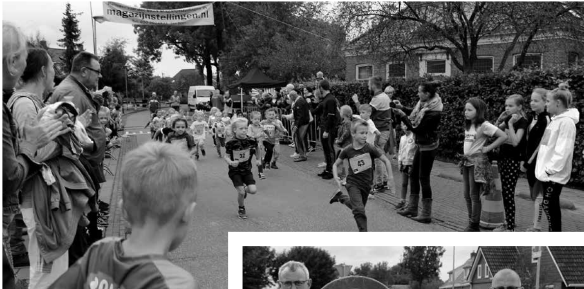
◀ Traditioneel begint de Thesinger Dörpsrun met de Kidsrun