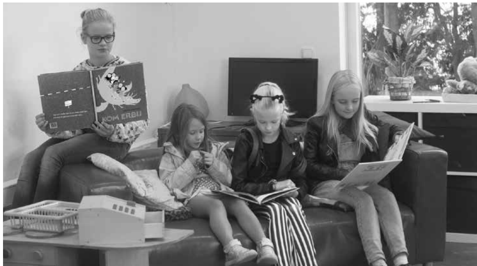
Lekker op de bank met een goed boek over vriendschap