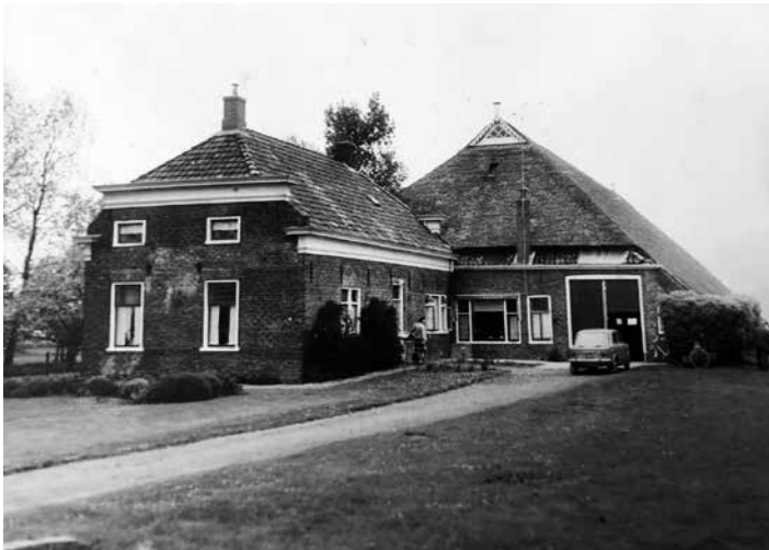
Het oorspronkelijke huis aan de Geweideweg