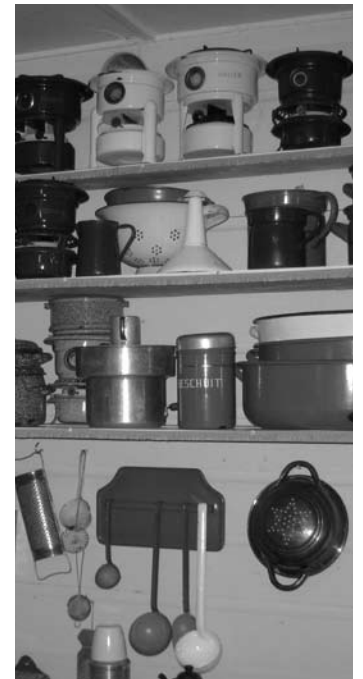
Blikjes, trommels en andere oudheden.

Janna Hofstede, contactpersoon en coördinator Noaberstee