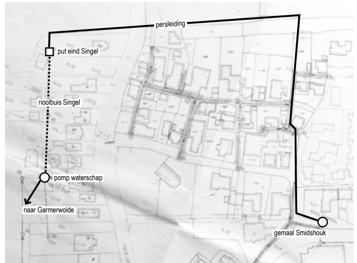
De huidige situatie van het riool in Thesinge

In de weken na de overlast hebben gemeente en waterschap met adviseurs