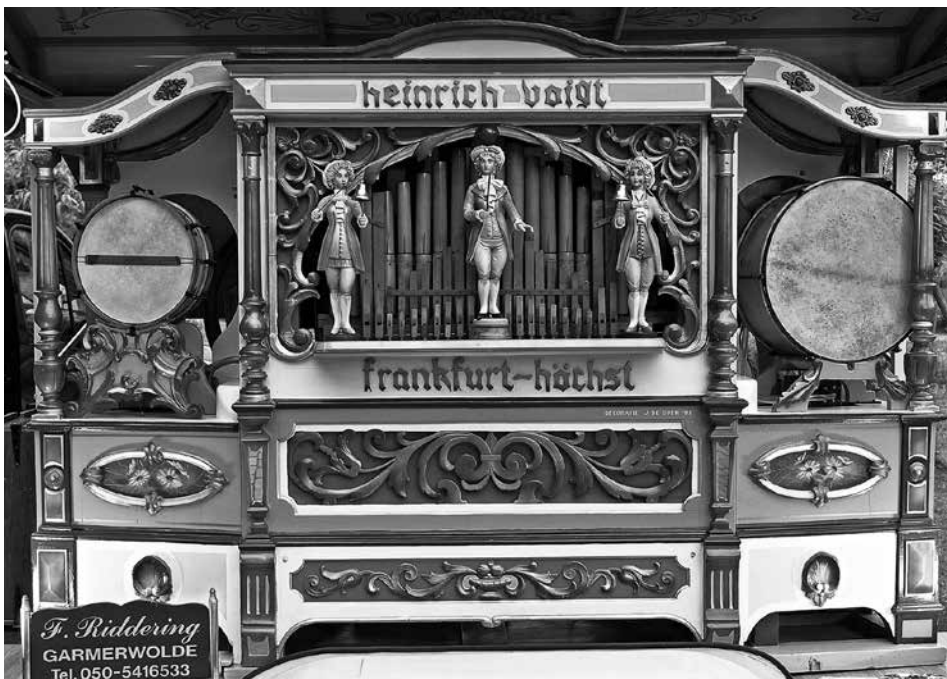
De 52er Voigt