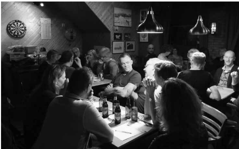
Volle bak in café Jägermeister