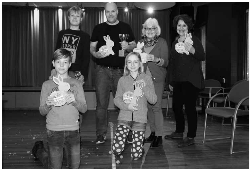
De prieswinnaars van het aaier zuiken en neuten schaiten in Taisn