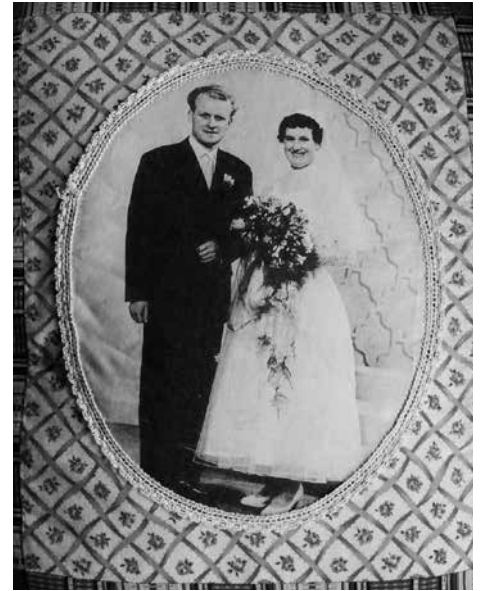
De huwelijksfoto is op een kussen genaaid

'We hadden vroeger wel leidingwater, maar geen waterleiding', vertelt Kees. Het water werd aan huis gebracht, in een waterkelder opgeslagen, en je moest het zelf oppompen. Als ik mensen nu soms hoor klagen, dan denk ik: waar heb je het over?'