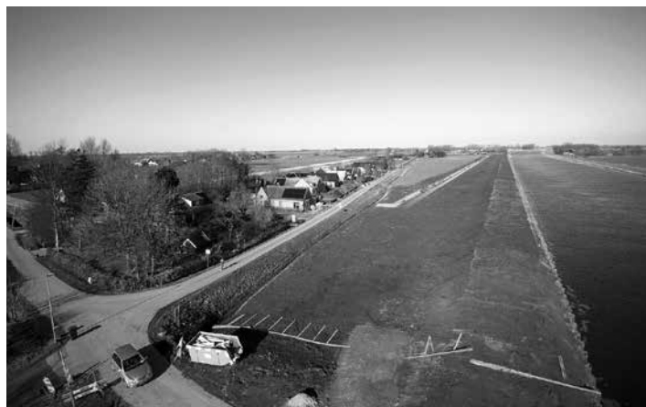
Het Dijkpark vanuit de lucht