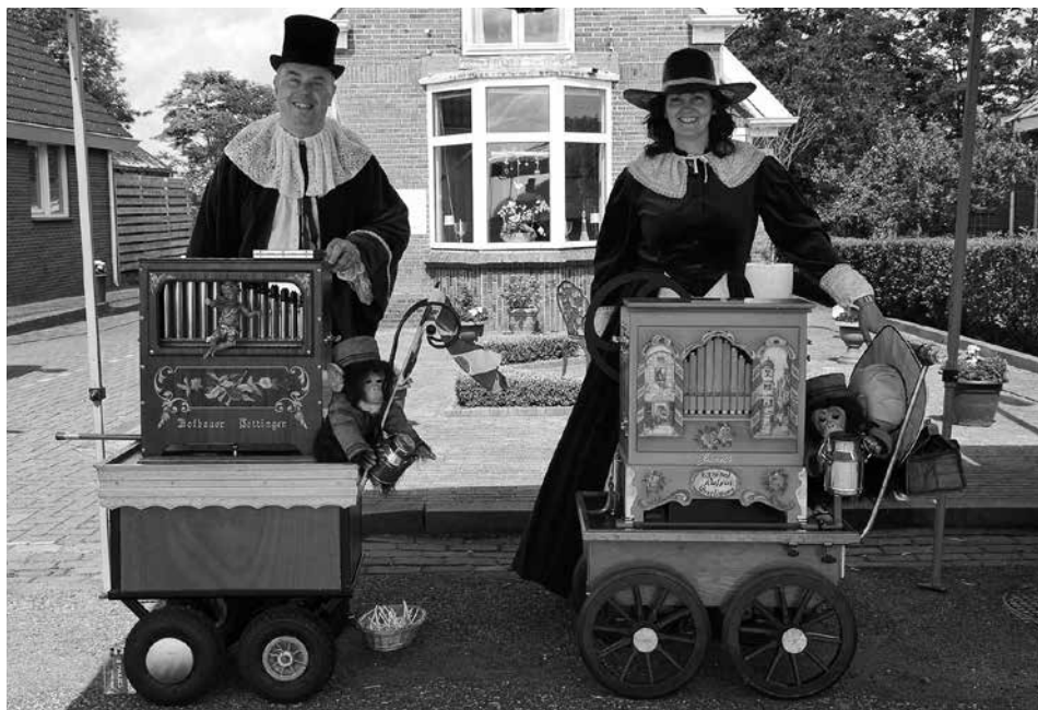
Minidraaiorgels