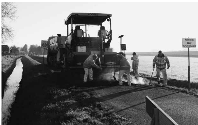
Het laatste stuk onverharde doorgangsweg in Garmerwolde behoort tot het verleden nu ook de Grasdijkweg helemaal verhard is