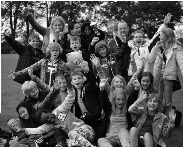
CBS de Til deed dit jaar mee in de gemengde poule. Er waren ook veel supporters meegereisd. Er werd goed gespeeld en zeker even goed aangemoedigd. Van de acht wedstrijden hebben ze zeven gewonnen en een verloren. Er klonk luid gejuich toen bleek dat de Til eerste van de poule was geworden.