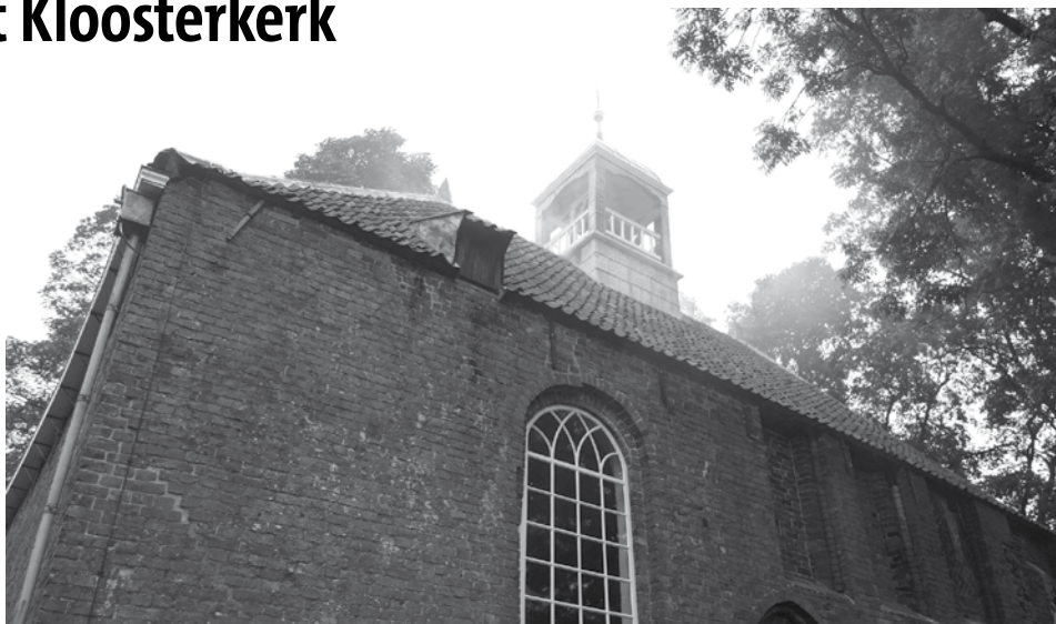
Rook of mist boven de kerk? Dat was de vraag

De boosdoener was kortsluiting in een lamp die de avond daarvoor tijdens een repetitie van The Singers de geest had gegeven en direct vervangen was. Geschrokken van een en ander willen men nu alleen nog veel minder hete ledlampen gaan gebruiken. Een gelukje was ook dat er sinds de restauratie een vlamvertragend isolatiemateriaal op de zolder ligt, daar waar de