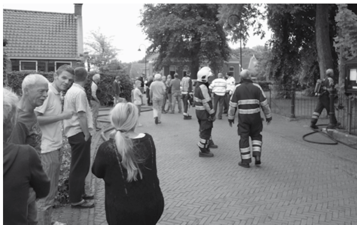
Veel geschrokken Thesingers waren vroeg uit de veren