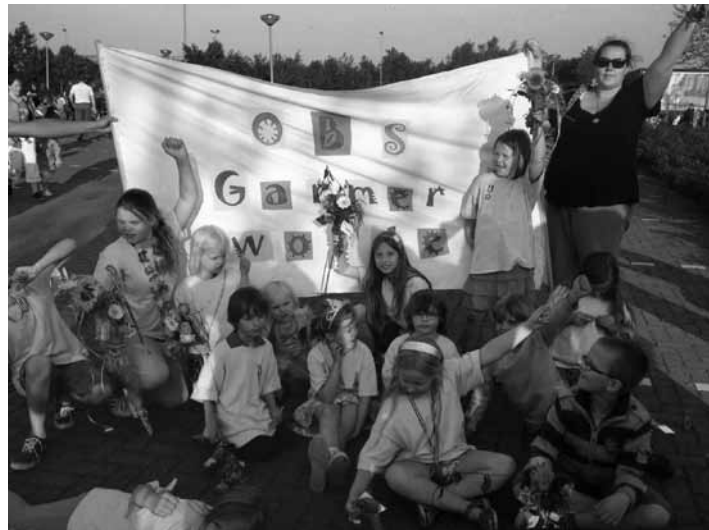
De kinderen van OBS Garmerwolde zijn blij met hun medailles