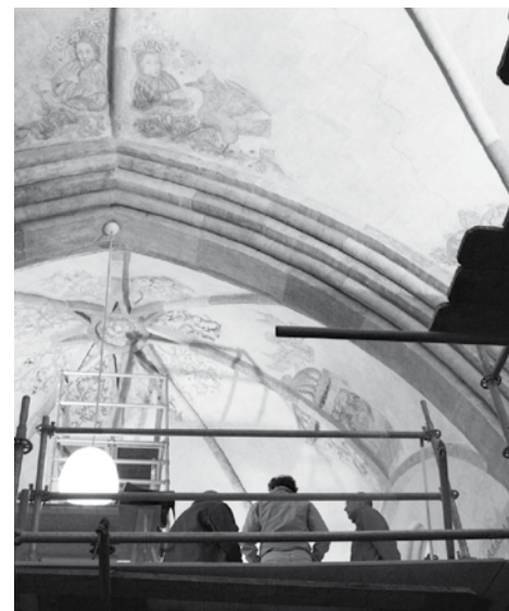
De eeuwenoude schilderijen op ooghoogte

Bijna tweehonderd mensen kwamen een kijkje nemen. De jongste bezoekers konden intussen met minibaksteentjes een gewelfje metselen. De Plaatselijke Commissie verkocht Garmerwolder kloostermoppen, volgens geheim recept gebakken koeken. En om de restauratiekas nog verder te spekken bracht de commissie ook restauratiewijn aan de man, in een fles met een exclusief etiket. Mocht u nog willen genieten van een smakelijke rode Merlot en daarmee de restauratie willen steunen: er zijn nog enkele flessen te koop. Mail naar kerkvangarmerwolde@gmail.com .