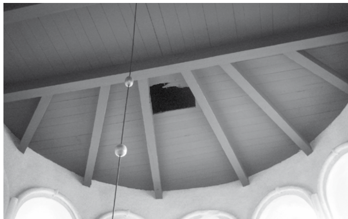
De schade...!