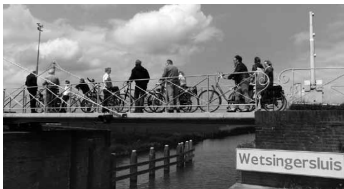
Passage Wetsingersluis