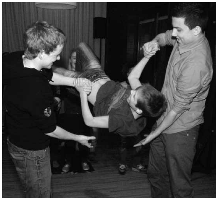
Moeilijke capriolen bij de dansworkshop