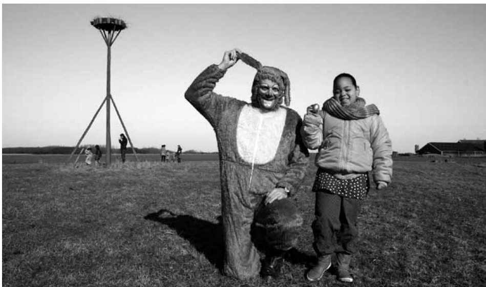
Een van de winnaressen van een gouden ei