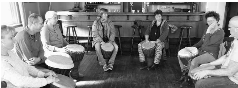
De leerlingen 'slaan' erop los (foto: Sieb-Klaas Iwema)