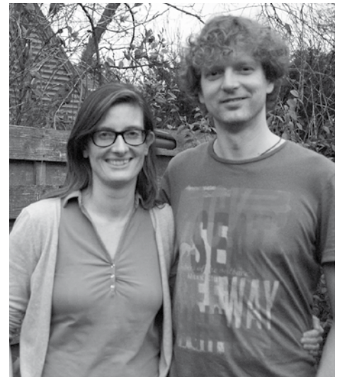
De nieuwe redactieleden

Beiden: 'We hopen via ons redactiewerk meer