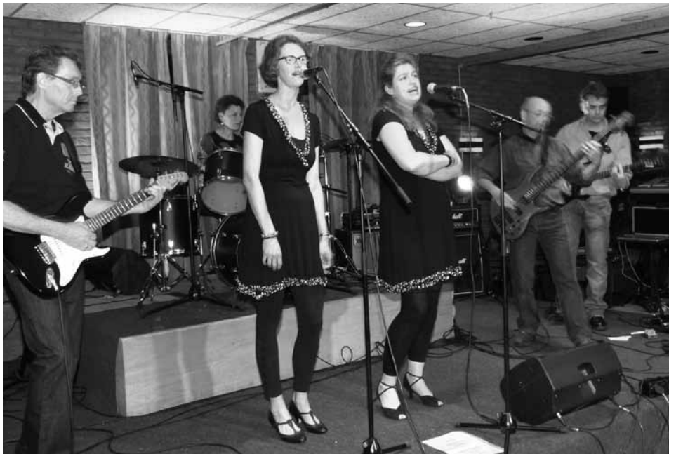
Swingend Deeply Damned