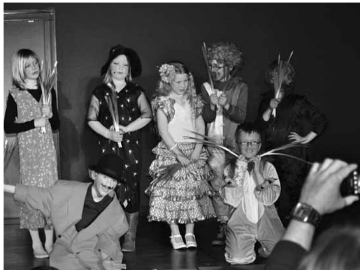
De jongste groep uit Garmerwolde