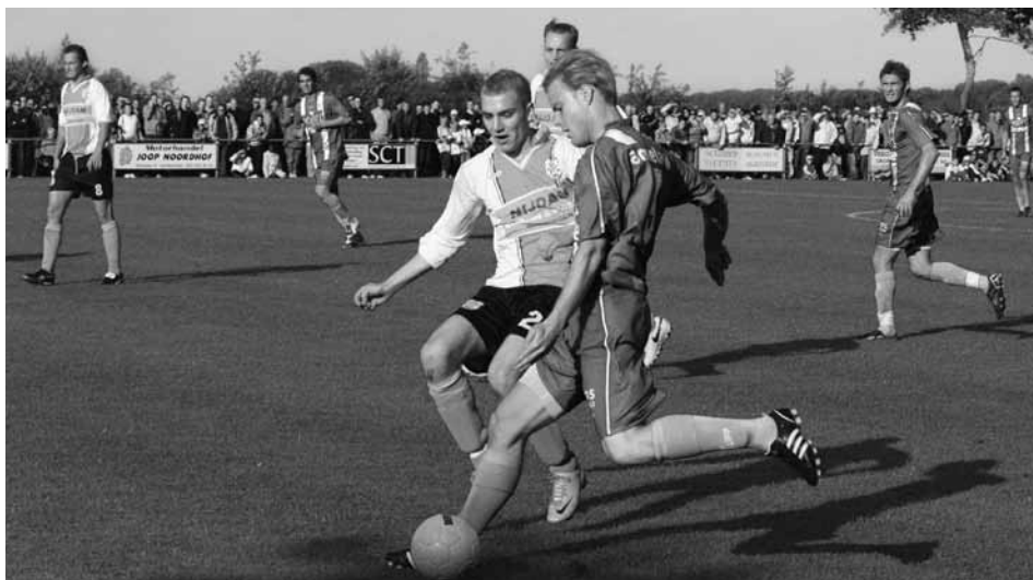
GEO in actie tegen eredivisieclub FC Groningen