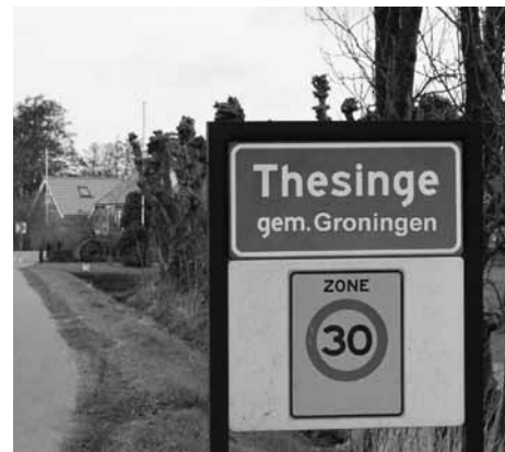
Is dit de toekomst?

missie er toe leiden dat wij voor het einde van 2017 inwoners worden van een grotere gemeente 'Stad Groningen' die bestaat uit de huidige gemeenten Ten boer, Groningen, Haren en delen van Slochteren (i.v.m. Meerstad).