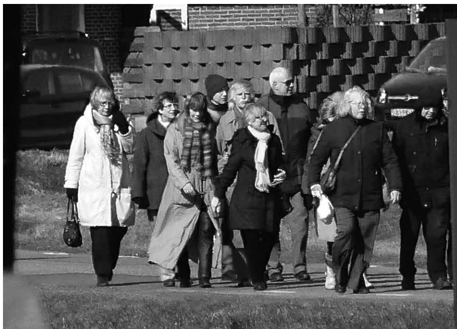
De paaswandeling bijna ten einde