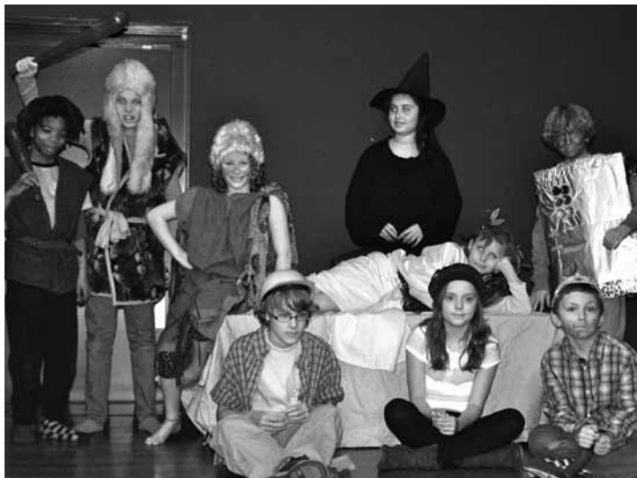
De tijdreizigers uit Thesinge