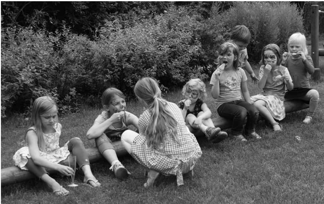
Foto van de maand Kinderen van OBS Garmerwolde genieten van ijs tijdens de feestelijke opening van het nieuwe schoolplein