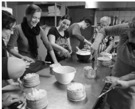
De 'torens' in aanbouw

Zou je deze workshop ook willen doen? Er komt bij voldoende belangstelling een herkansing.