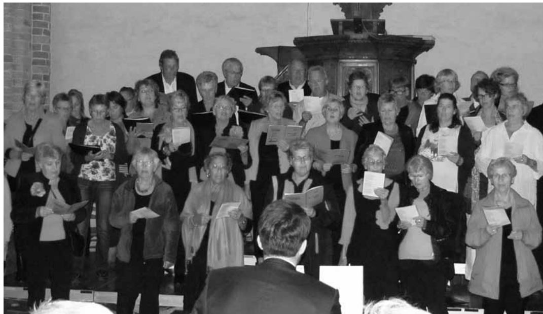
Het GMKG en het Dameskoor Oosterhoogebrug tijdens het meezingconcert