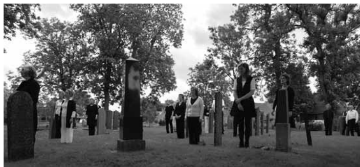
De opkomst tussen de graven