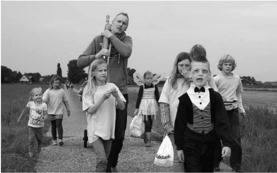
De Avondvierdaagse leidde de leerlingen van OBS Garmerwolde dit jaar door wind en regen over mooie wegen