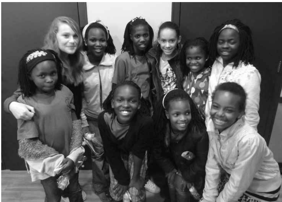
De kinderen uit Thesinge en Namugongo zijn voor altijd verbonden door fijne herinneringen