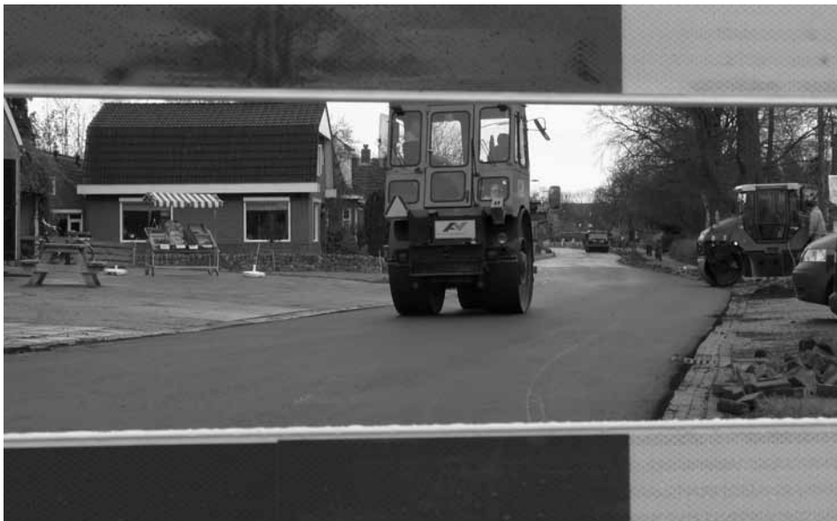
Garmerwolde gestremd wegens werkzaamheden