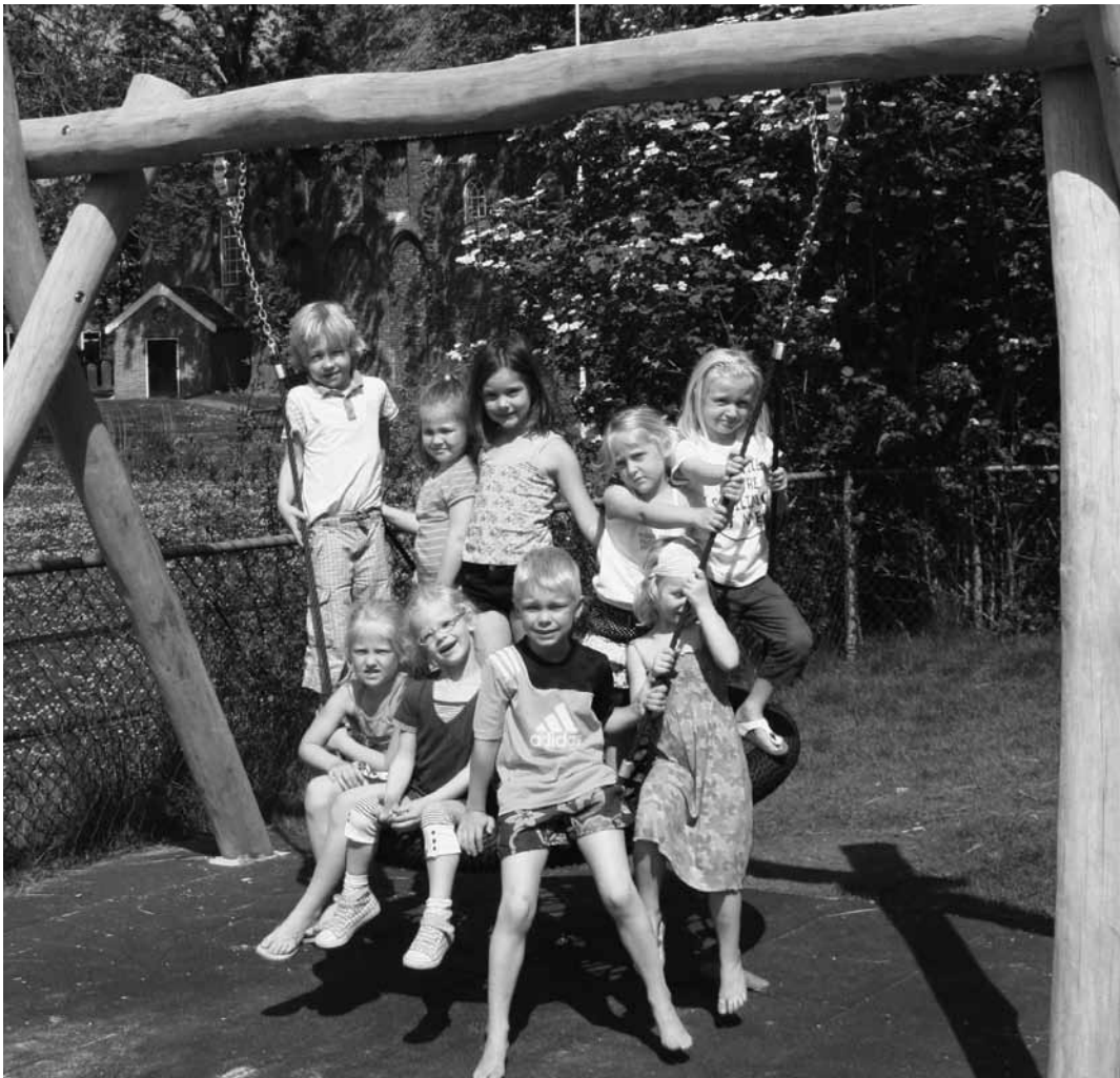
Alle kinderen van CBS De Til zijn erg blij met het mooie nieuwe schoolplein!