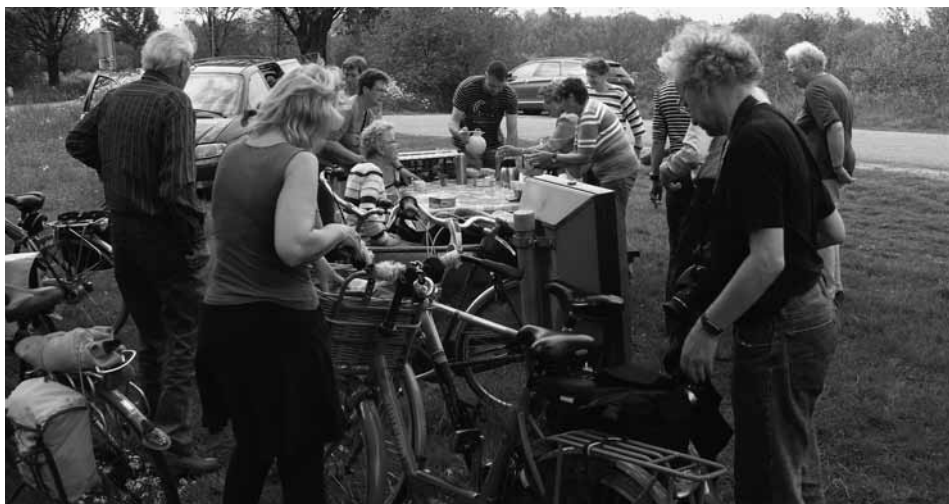
Koffie- / theestop onderweg

De activiteitencommissie Dorpshuis de Leeuw