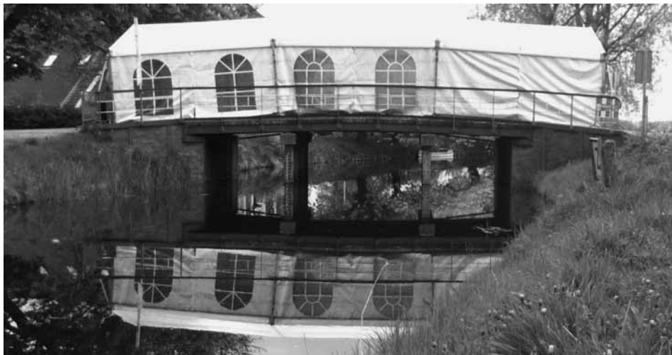
De partytent op de Taisner til

Begin mei was de brug in Thesinge een aantal dagen afgesloten wegens werkzaamheden.