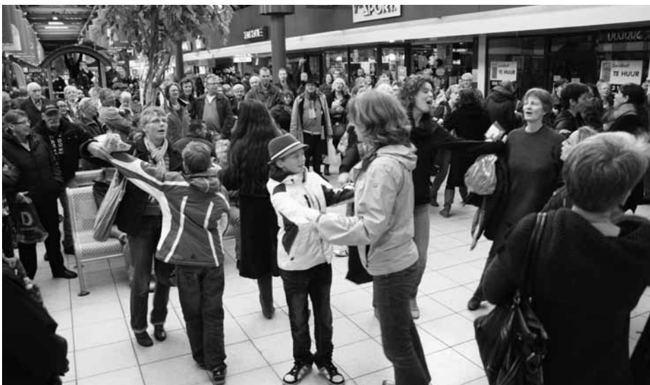
De flashmob in winkelcentrum Paddepoel; zingen en zwieren op de muziek van Verdi