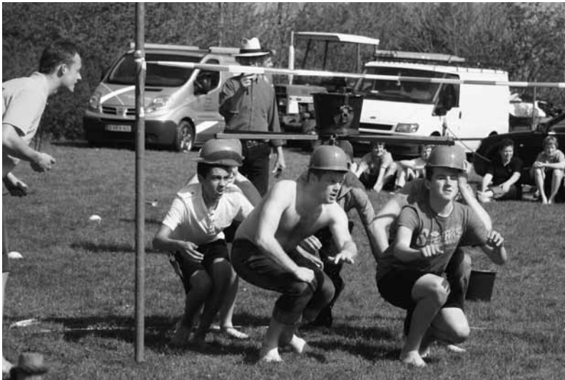
Achter-Thesinge in actie op de stratenzeskamp