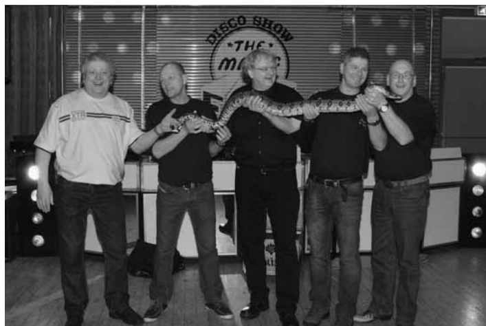
The Magic Five in de weer met de slang van Samiera