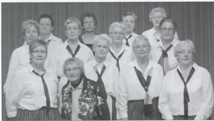
De Meulendaansers vieren hun 30-jarig jubileum.