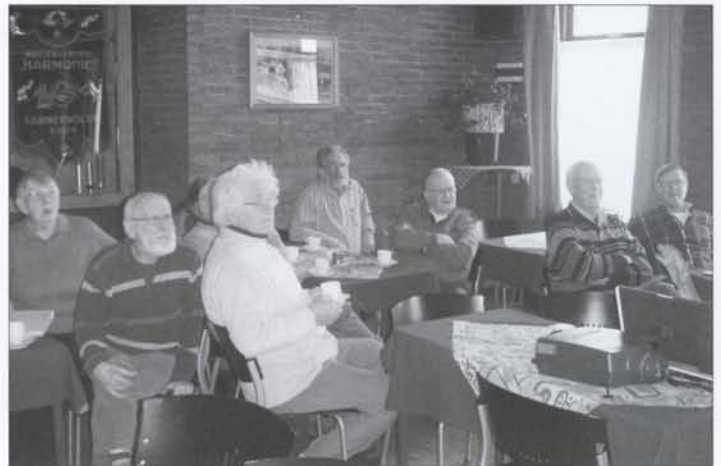
Volop aandacht voor de getoonde foto's