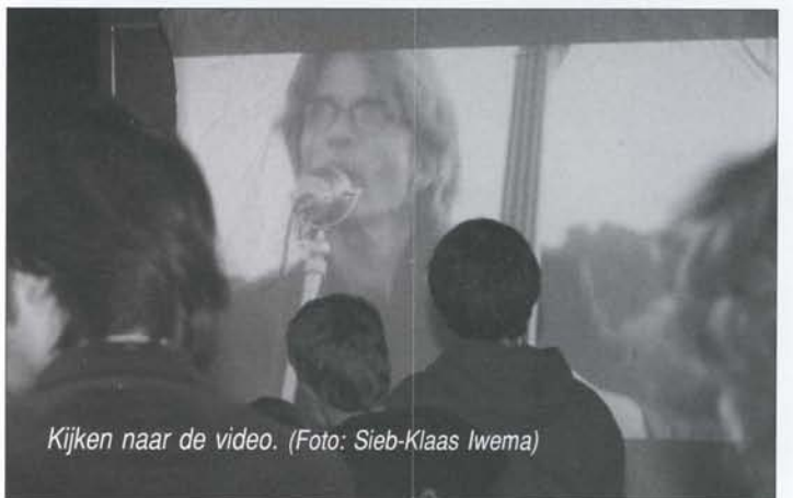
Kijken naar de video.