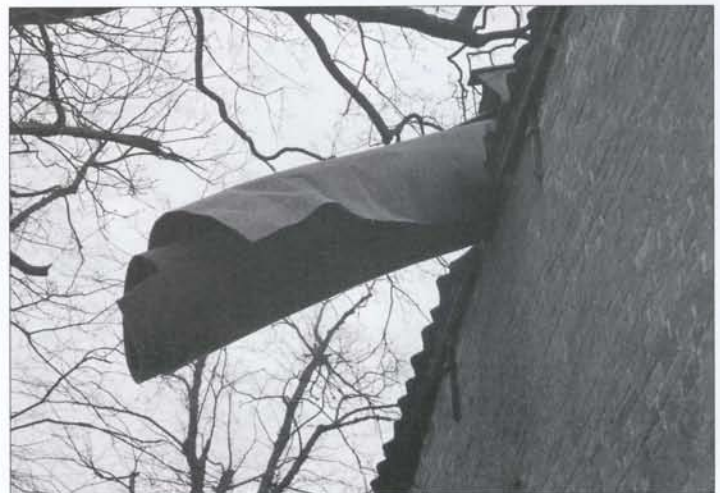
Door de kleine luikjes in het dak van de kerk werden de rollen tapijt naar beneden gestort.