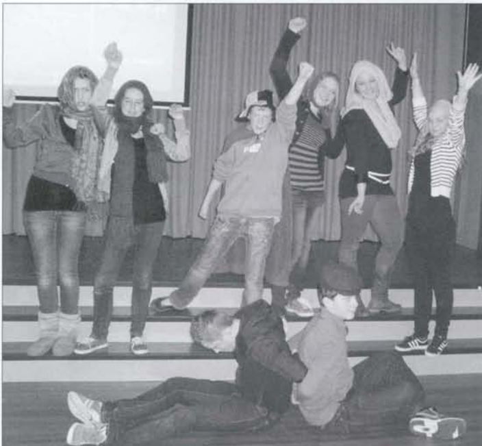
Team Taisn 2 met hun zelf bedachte dans op het bekende nummer Grease Lightning.