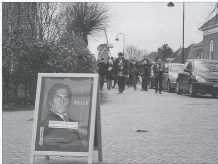
De bezoekers van de voorstelling Zelle gaan ter kerke.

Zelle had uitgesproken meningen; vrouwen vond hij lastig, bemoeiden zich overal mee, homo's werden aan hun Lot overgelaten, en laten we maar zwijgen over negers.