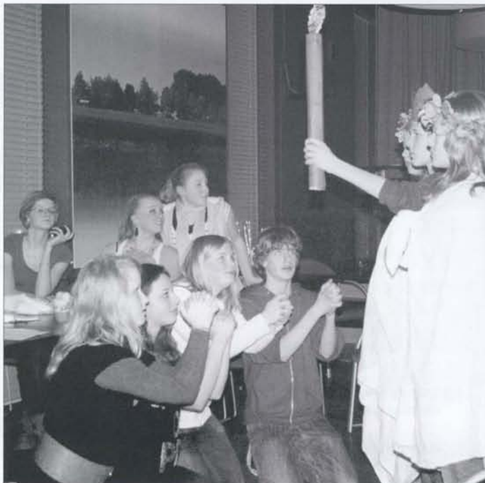
Team Taisn 1 met hun foto-opdracht, het maken van een fotostrip.