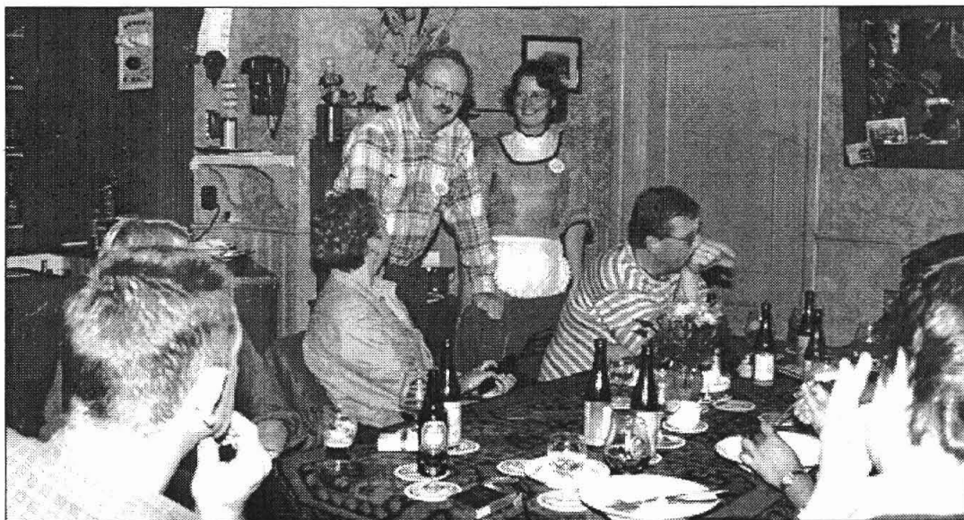
Voortaan elke zaterdag ...

In het café van Jopje ontstaat een fikse ruzie. Een wakkere politiemann is ter plaatse en lost een waarschuwingsschot in de lucht. Van schrik vlucht Jopje door het luik – achter