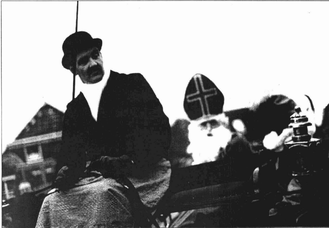
Vorig jaar kwam Sint met de koets in Thesinge en werd zijn staf gestolen. Hoe zou het dit jaar gaan??