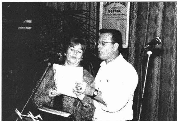
De Jodi's kunnen heel mooi zingen!

Het laatste deel wordt geopend door het Gemengd Mannenkoor o.l.v. Djoeke de Boer. Zij zingen drie liedjes over liefde en geluk. Jos Mocking kondigt de boel aan; Douwe