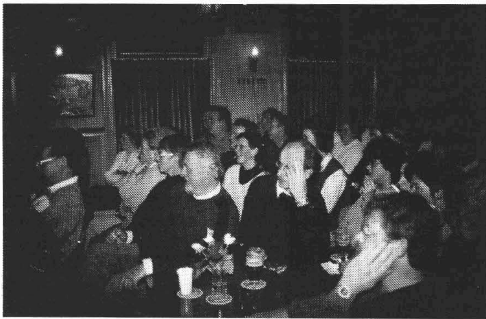
"Ist spannend lu?".

gewoar worden bennen het Taisn doezend gulden wonden mit heur repport over wat ien Taisn gebeurt en gebeurten zel. Henk Busscher ien 't bezunder het hier'n bult waark veur verzet en doarveur krigt hai 'n dik applaus en ain aordighaidje.