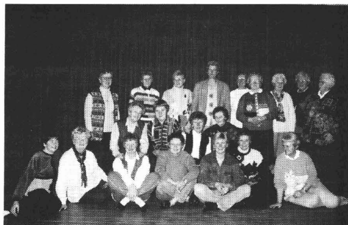
De volksdansgroep komt op maandagmiddagen bijeen. Nieuwe leden zijn welkom!