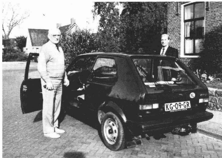
Ouderen kunnen bij Vriesema een 'Broem-test' doen.

Ten slotte krijgt men een officieel uitslagformulier en een