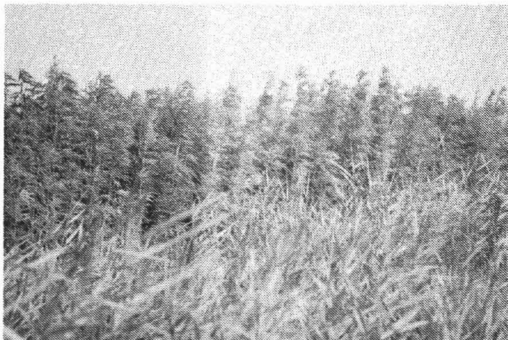
Het hennepveld in Flederbosch (aan de voorkant staat riet). Door de hoogte van het gewas raak je je richtinggevoel volkomen kwijt ... je hebt geen flauw idee waar je loopt! Tegen het eind werd het hennepveld ontdekt en kwamen er verdacht veel vreemdelingen in Flederbosch: ze loerden schichtig om zich heen en spoedden zich richting hennep. Ze dachten natuurlijk een flinke slag te slaan, maar dat viel tegen! Van industriële hennep moet je wel 25 kilo roken om een klein beetje "stoned" te worden.

(deze lijkt veel op de inhoud van een vlierbessentak) en bast, ook wel schorsvezel genoemd.