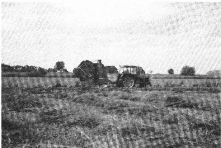
De hennep wordt in ronde balen geperst.