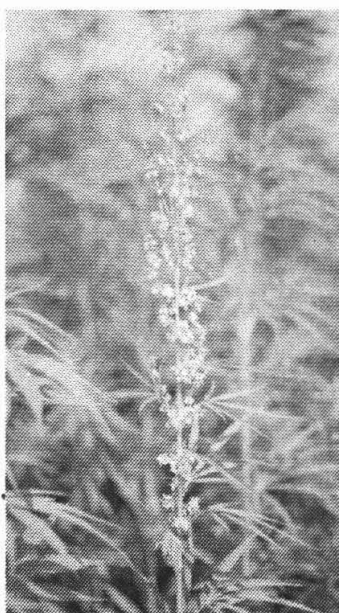
Hennep in bloei. Als je rond deze tijd door het veld loopt, bedwelm je bijna.

De plant op zich bestaat uit twee delen: de kern of hout