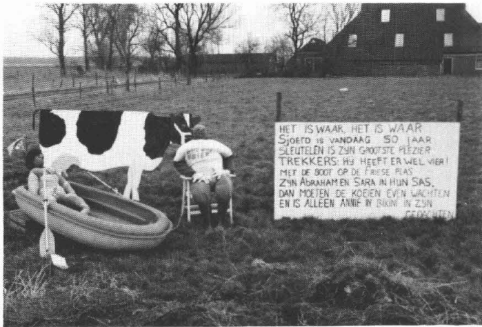
Sjoerd Hoekstra vierde z'n vijftigste verjaardag.