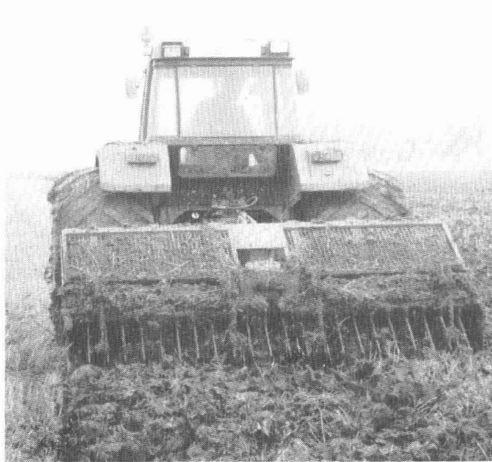
De spitmachine moest er aan te pas komen.

"Wij verbouwen granen en suikerbieten op ons bedrijf van 60 hectare. De suikerbieten zitten nog in de bult, maar die zien er wel goed uit. De tarwe is van slechtere kwaliteit dan andere jaren en brengt dus minder op. De laatste 3 weken is het droog, maar de verdamping is nul. De grond blijft te nat om met eigen materiaal te ploegen.