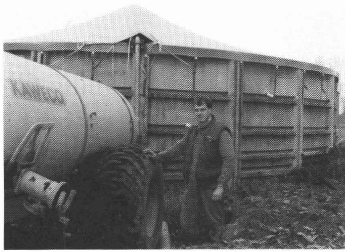
Het dak van de mestsilo mag er in 1996 weer af.

"Uitrijden in februari is voor land en plant gunstig. Vroeger werd het land vernield door er in herfst en winter