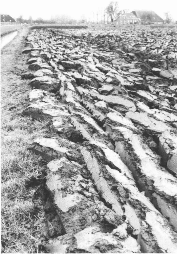
Als broodjes liggen ze er weer, de omgeploegde klei.