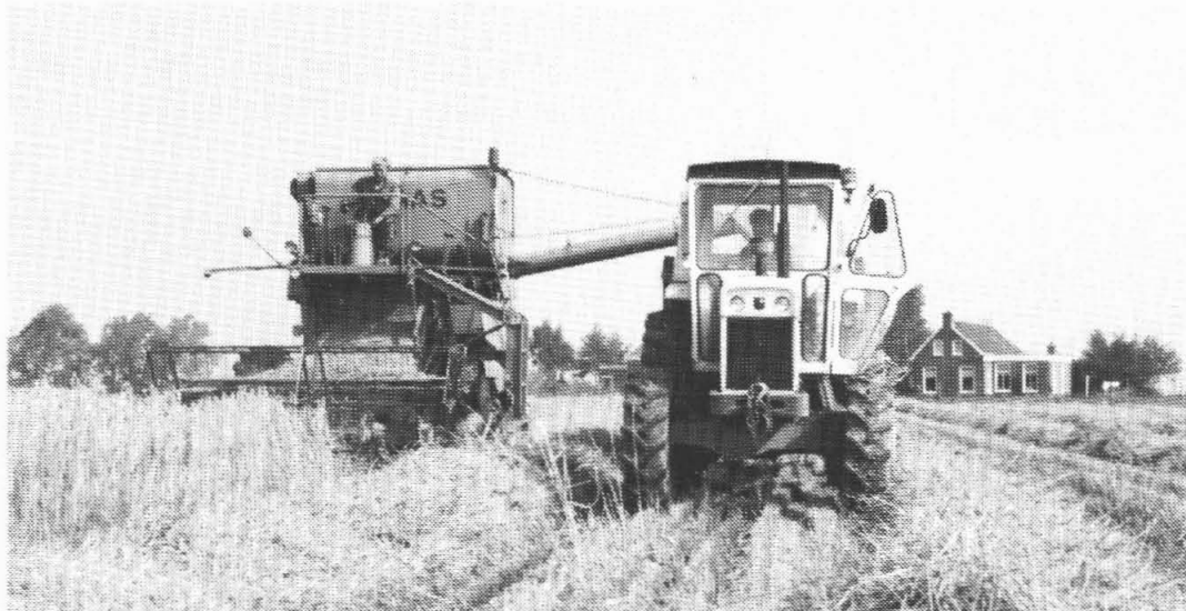
De oogst wordt laat binnengehaald.

'Iedere boer die bieten verbouwd is aan een bepaalde hoeveelheid gebonden. Deze regeling is er om een bepaalde productie in stand te houden. Voor deze quotumbieten wordt een bepaalde prijs betaald. Produceer je meer, dan wordt voor de rest de geldende prijs op de wereldmarkt betaald. Die ligt een stuk lager. Het quotum kan wel uitgebreid worden, maar dan moet er tegelijkertijd ook land bij gekocht worden waar bietenquotum op ligt. Evenals bij melk ligt de quotum op het land en is dus niet vrij verhandelbaar. Bij het graan is het weer een heel ander verhaal. Hier wordt aan productiebeperking gedaan door braaklegging (dat wil zeggen het land niet voor productie gebruiken). In 1990 was er een regeling dat boeren vrijwillig een deel van hun land konden braak leggen. Hiervoor werd dan een premie betaald. Dit geldt gedurende vijf jaar. Sommige boeren hebben hieraan meegegaan uit financiële overwegingen. Maar dit jaar is ingegaan dat de boeren verplicht 15% van hun grond in de braakregeling moeten doen. Als zij dit niet doen, wordt er geen hectare-vergoeding betaald. De boeren krijgen hiervoor wel een premie, maar die compenseert bij lange na de daling van de graanprijzen niet. Deze regeling, die bedacht is door MacSharry, moet er op neer komen dat de dalende graanopbrengst gecompenseerd wordt door