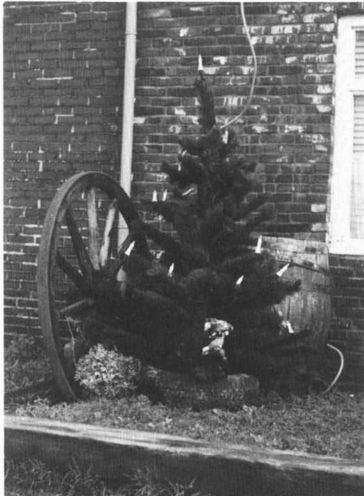
Kerstfeest bij de fam. Ates in Garmerwolde, "in één van de vier huisjes".

Vroeger wemelde het ook al van de speciale decembergewoontes. In de stad bij-