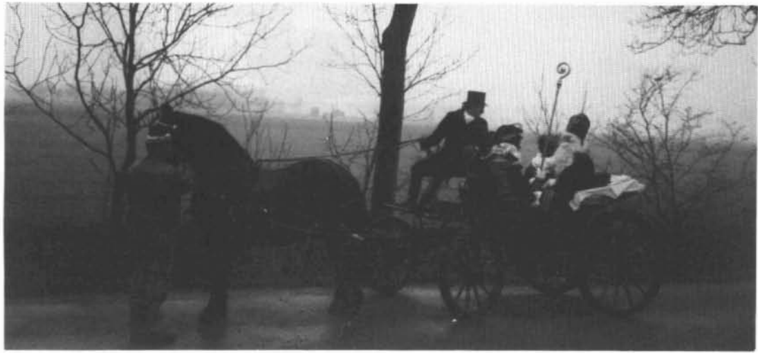
Sinterklaas komt in Thesinge per koets aan.