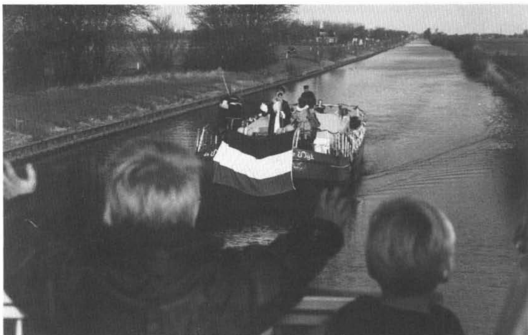
Sinterklaas wordt met open armen ontvangen in Garmerwolde.