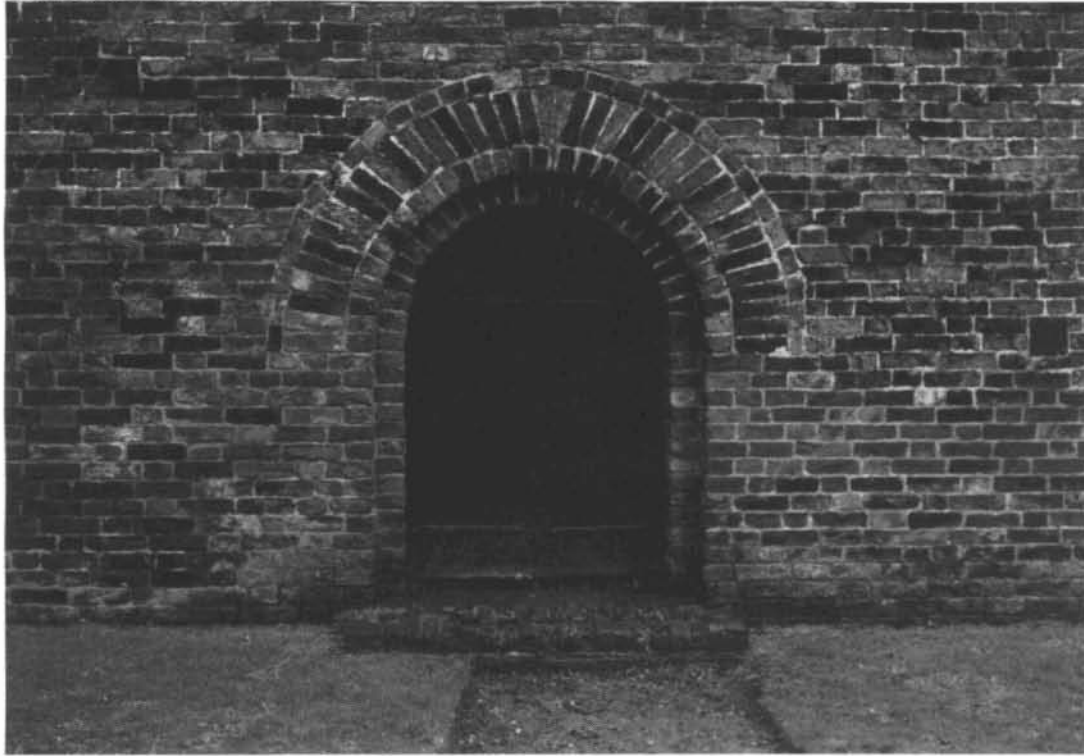
Ingang klokketoren kerk Garmerwolde.