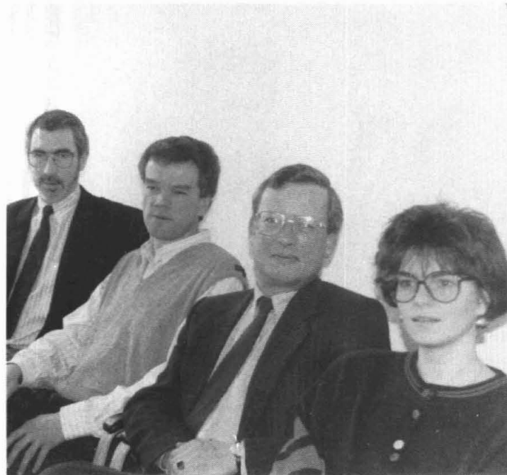
Het volledige team van het notaris kantoor.