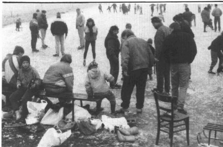
Drukke van belang op de ijsbaan in Thesinge.

ren tegen aan kunnen. Dit jaar gaat dat gebeuren op 25 maart 1992 in het Buurhoes te Ten Boer. Doet u mee aan de Verkeerskwis? Elke vereniging/organisatie mag meerdere teams van drie personen afvaardigen. Per team kunnen zij samen dan 210 punten verzamelen. Er worden 70 dia's getoond met diverse verkeerssituaties waarin uw kennis wordt getest. Het maximale aantal deelnemers is gesteld op 60 personen (dus 20 teams). Be-