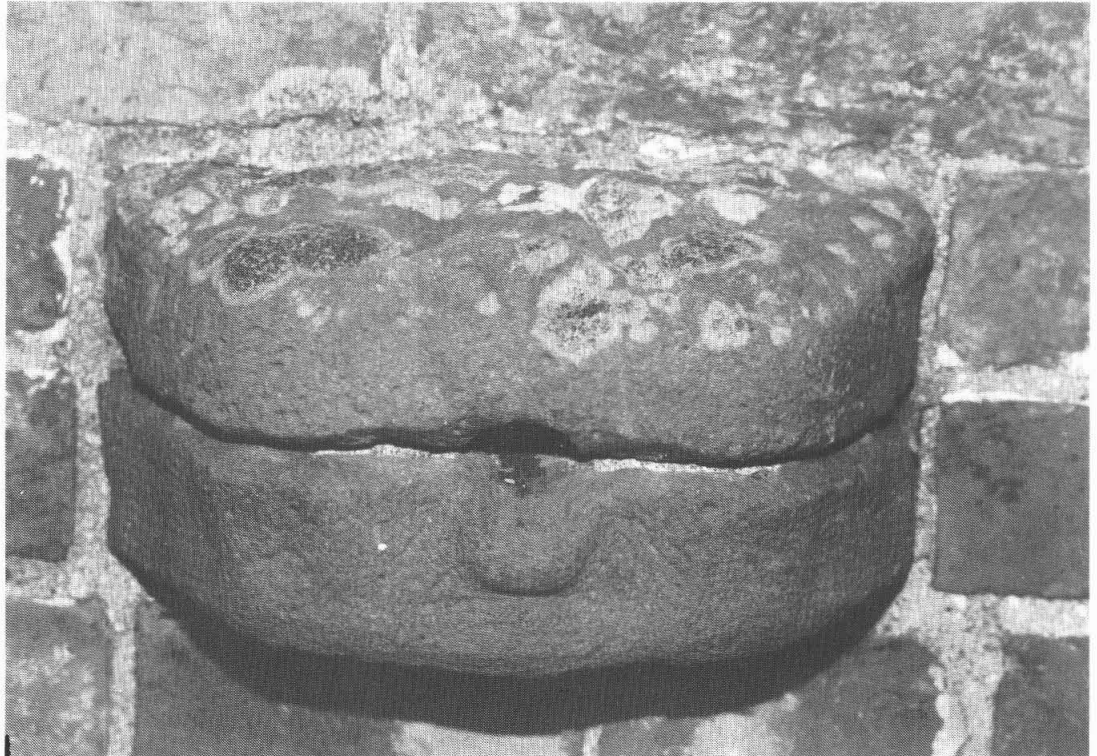
Detail van de kerk: een afvoer (piscina) in de vorm van een leeuw.

gel verwijderd en is er een nieuwe voor terug gekomen.