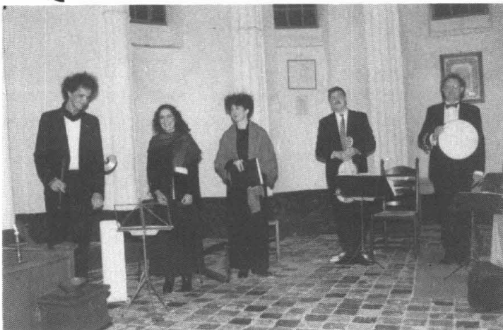
Super Librum in de Thesinger kloosterkerk.

boeken en artikelen duidelijk gemaakt wat dokters eigenlijk bedoelen als ze moeilijke dingen zeggen. Bekend van hem is onder andere zijn handboek Medicijnen. Voor