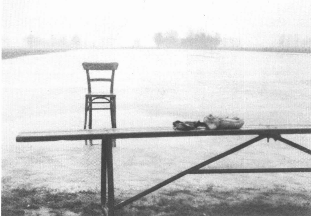
Restanten na kortstondige ijspret.