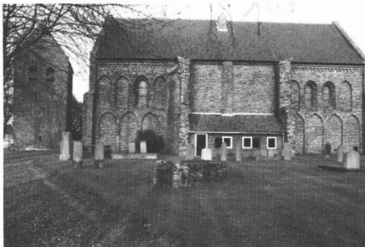
Hervormde Kerk in Garmerwolde.

De romaanse-gotische kruiskerk en toren zijn gebouwd in