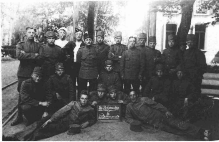
De 'Bolsjewikenvangers' in Bellingwolde.

verdeeld in enerzijds patrouilles lopen en anderzijds het bewaken van een grensbrug. Een eenheid bestond uit vier man en een burger-Commies of een soldaat-Commies en de dienst duurde 24 uur per keer. Ondanks onze bewaking werd er onverminderd gesmokkeld en op een gegeven mo-