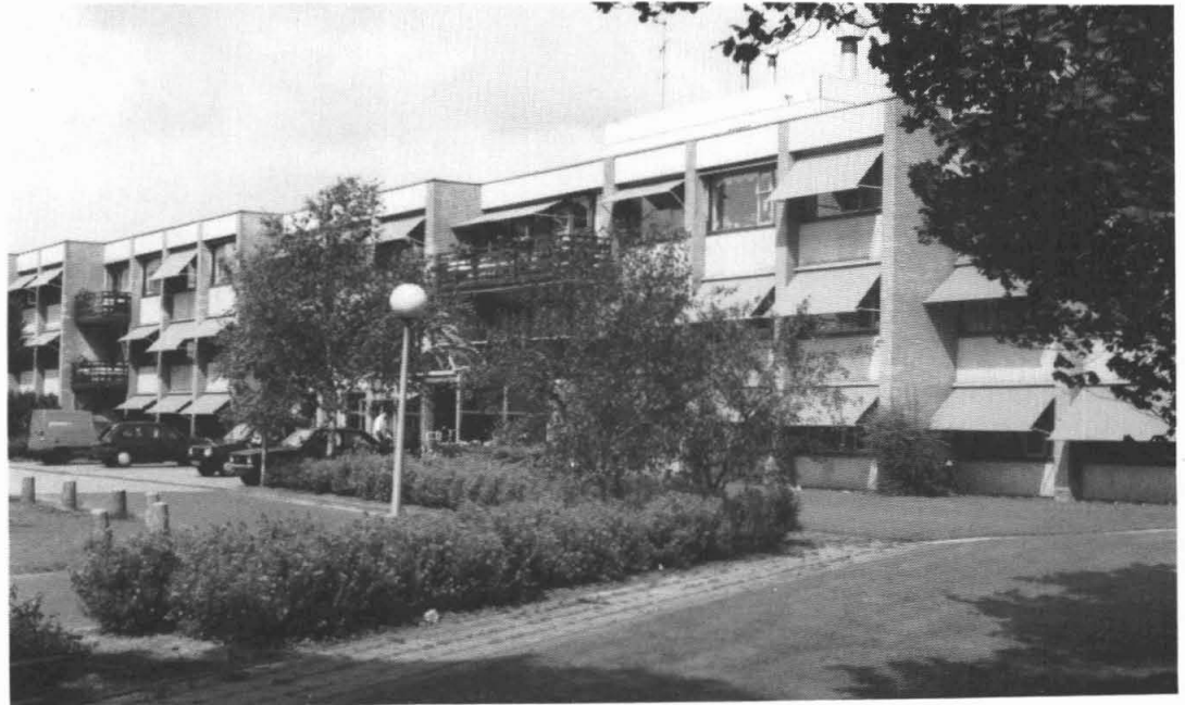
"Bloemhof". Tide Dijkema is blij dat hij er zit.

Over het wonen in Thesinge: "Dat was goed, maar vroeger hadden de gereformeerden de overhand, je had slechts een beetje omgang met mekaar, ook die gescheiden scholen werkten dat in de hand. Onze kant hing er maar