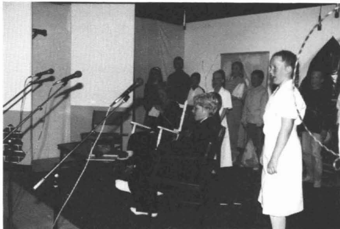
De klas van meester Dick Groenhagen voert de musical "Net op tijd" op.

Voor aardappelen, groenten, fruit, exotische vruchten en primeurs gaat U naar de