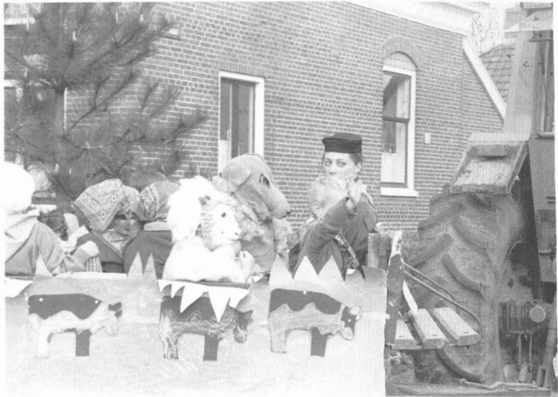
Koninginnedag met als thema: "de Boerderij".