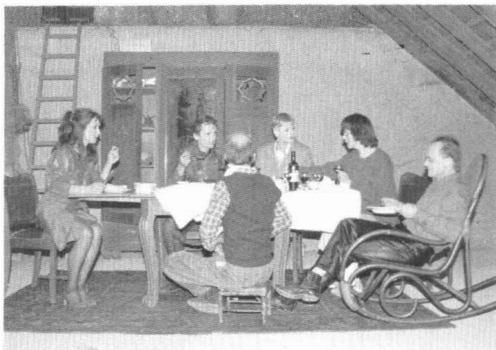
Toneelstuk: Met mes en vork.