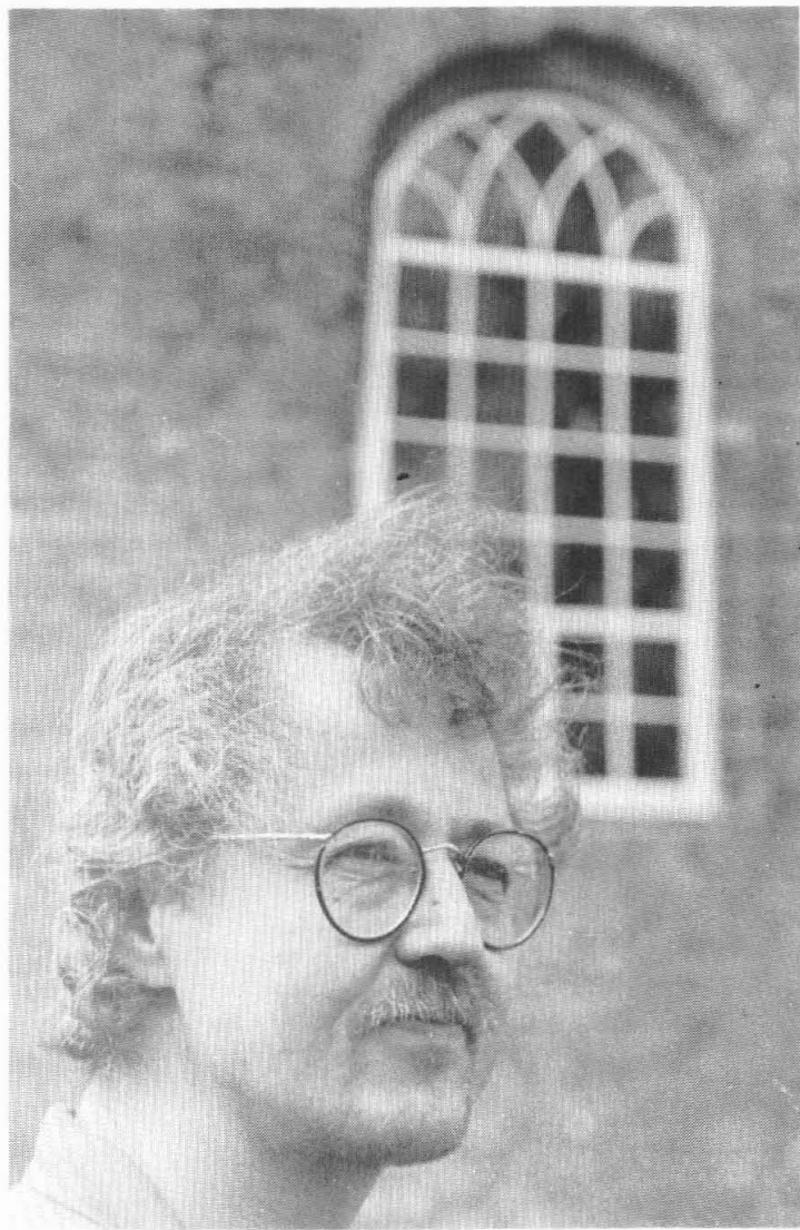
Haye v.d. Oever voor de Abdijkerk in Thesinge.

Prof. Marrow is expert op het gebied van middeleeuwse handschriften van Noord-Nederland en vond dit boekje in het veilinghuis Sotheby's in Londen. Aangezien hij van mening is dat dergelijke boeken thuishoren in het gebied van herkomst kocht hij het en schonk het daarna aan de Rijksuniversiteit Groningen. Het Nieuwsblad van het Noorden wijdde op 28/12/89 een artikel aan deze uitzonderlijke schenking en beschrijft het boekje als volgt: "Het getijdenboekje is in het Middelnederlands geschreven, telt 215 perkamenten bladen van 11,5 bij 8 cm en bevat behalve de heiligenkalender ook de Getijden van Maria, de Eeuwige Wijsheid, de Heilige Geest en het Heilige Kruis. Verder staan er de zeven Boetepsalmen in, de Litanie en tientallen gebeden tot Maria, Christus en verscheidene heiligen. Naast en