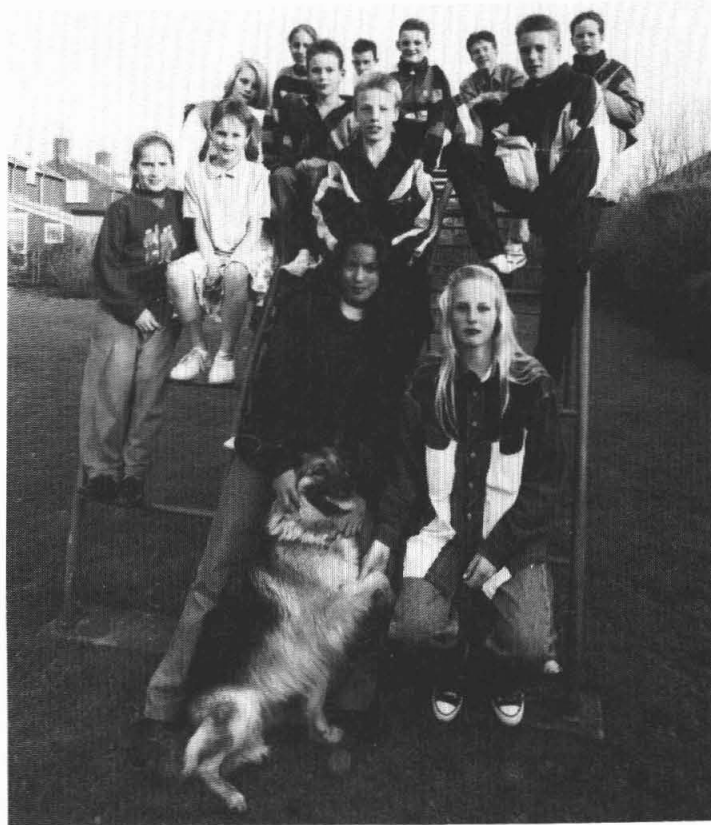
Jeugd uit Garmerwolde in actie voor een sportfaciliteit.

De vroegere kleuterschool lijkt de jeugd van Garmerwolde wel iets. De keet zal toch worden afgebroken en waarom zou het dan niet aan hen beschikbaar gesteld kunnen worden. Met enige hulp voor de lekkage kunnen