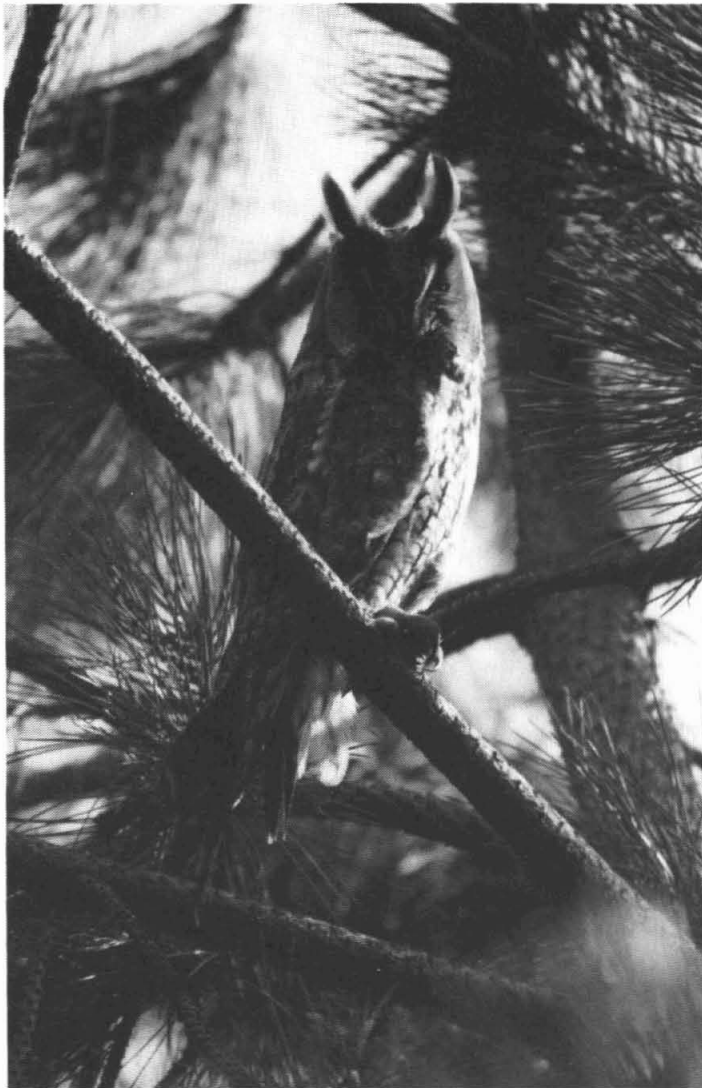
Dit is één van de twee ransuilen die 'wonen' in de tuin van de familie van Zalk aan de Schutterlaan in Thesinge.