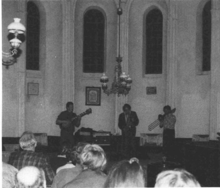
"Het podiumtrio in de Kloosterkerk te Thesinge".

trombone werd zo knap bespeeld en bleek zoveel verschillende klanksoorten te kunnen produceren dat je gerust van een herwaardering zou kunnen spreken. Ook de ambiance van de kerk speelt natuurlijk mee. In de pauze vertelden de musici mij dat zij niet ongewoon zijn in kerken te spelen. Makkelijk is dat