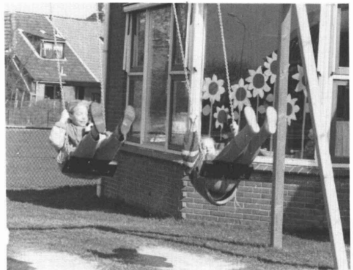
Zeer in trek zijn de nieuwe schommels achter de school van Thesinge. Ze horen nog bij het Kwetternest, het speelterreintje vóór, en ze zijn eveneens neergezet op initiatief van Dorpsbevelangen. Er komt trouwens nog een hekje omheen om te voorkomen dat peuters die bij de zandbak spelen, geraakt worden door al te enthousiaste schommelaars.

De ijzeren speeltoestellen aan de W.F. Hildebrandstraat moeten van een nieuwe verflaag worden voorzien. De speeltuincommissie zoekt vrijwilligers die dat samen met hen willen opknappen. Opgave bij de heer J. Mocking (050-418451).