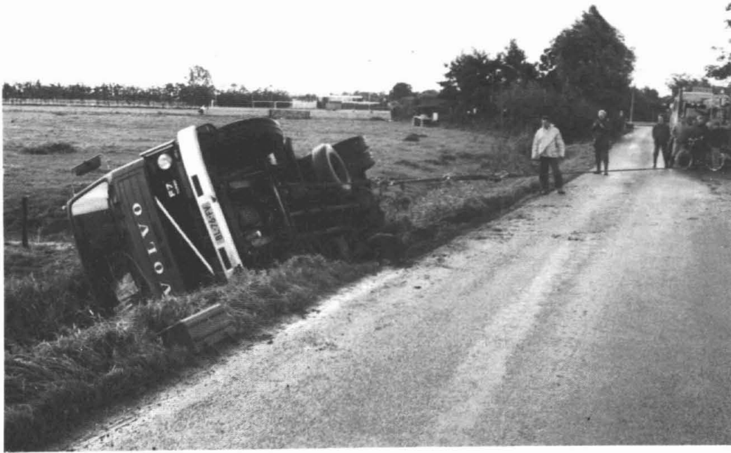
De gekantelde auto aan de Lageweg