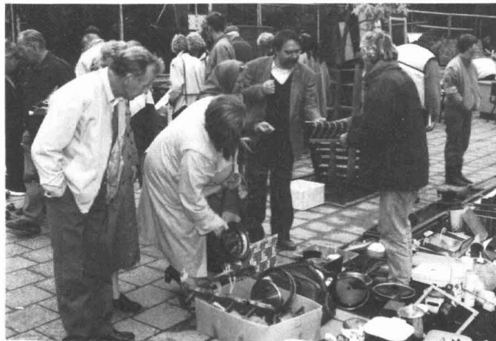
Op het schoolplein in Garmerwolde hield de Harmonie een rommelmarkt