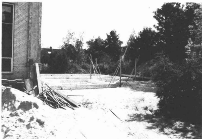
Nieuwbouw van de school in Garmerwolde.

Er is in Nederland een wet voor het basisonderwijs. Hierin staat o.a. dat de kleuterschool en de lagere school in één gebouw moeten zitten en dat dat geheel basisschool genoemd wordt. Bovendien moeten groep 1 en 2, de kleuters dus, gymnastiek onderwijs krijgen in hetzelfde gebouw.