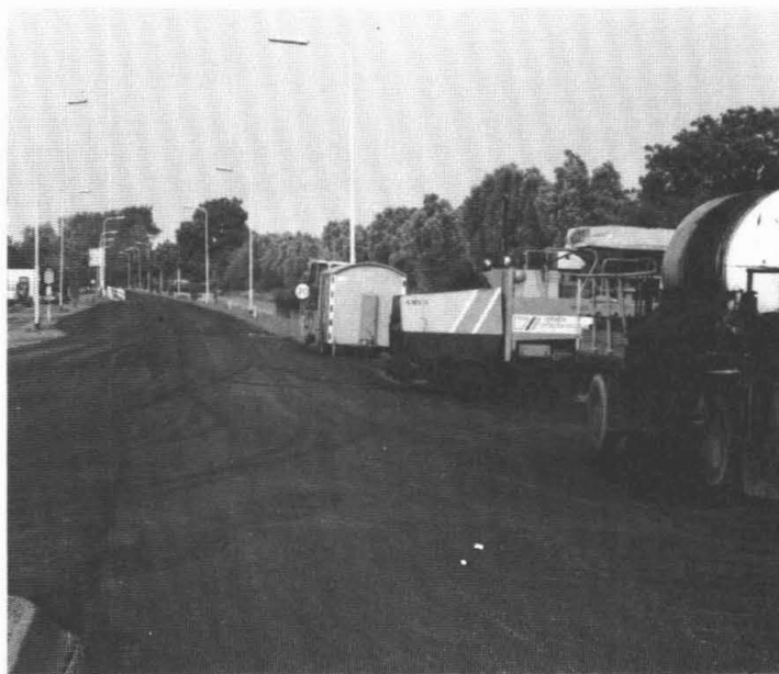
Werkzaamheden aan de Rijksweg.

Elk jaar is er in de provincie Groningen een bepaald budget beschikbaar voor het onderhoud van het provinciale wegennet. Alle provinciale wegen worden regelmatig gecontroleerd op sterkte. Dat wordt gedaan door de meetdienst, een deskundig bedrijf dat uitrekent hoeveel asfalt nodig is om een duur van twintig jaar te garanderen. 'Deze zogenaamde deflexie-meting', legt de heer Ebels uit, 'doet onze dienst niet zelf. Daarvoor schakelen we een bedrijf in. Een weg bestaat uit een fundering van 60 cm zand en 25 cm asfaltverharding. Dat asfalt slijt door de jaren heen. Bij de overlaging van de N41 zullen verschillende nieuwe lagen asfalt worden aangebracht. Bij Ruischerbrug zullen dat vier nieuwe lagen worden. Daar trekken dagelijks 12.000 motorvoertuigen langs. Bij de Gronam-garage gaat het om twee nieuwe lagen. De rest van de N41 heeft genoeg aan één nieuwe laag. Daarmee wordt het wegdek versterkt, zodat het zo'n twintig jaar weer mee kan'.