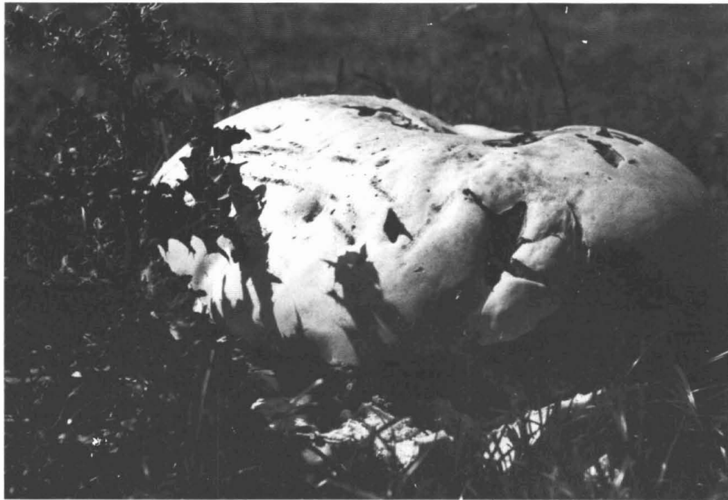
Ook Garmerwolde heeft zijn reuzenpaddestoelen: Reuzenbovist, in het weiland van de fam. Werkman.