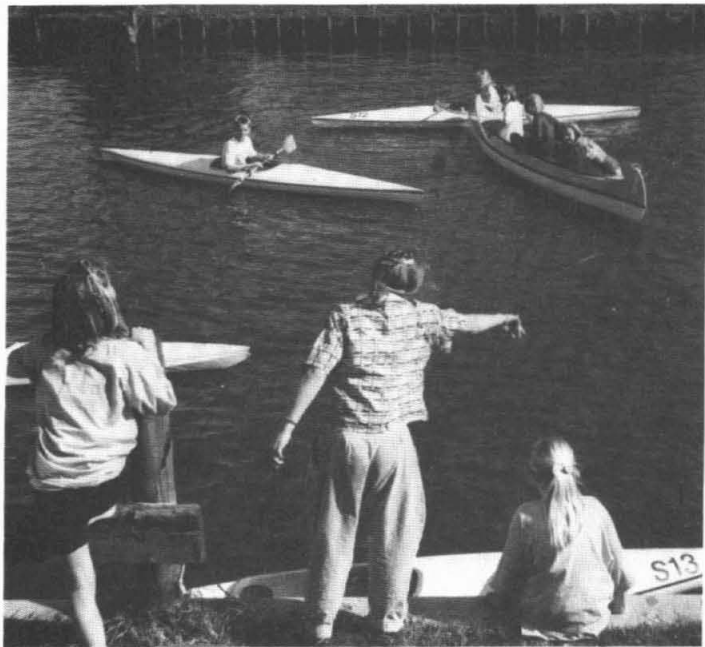
30 april feest in Garmerwolde