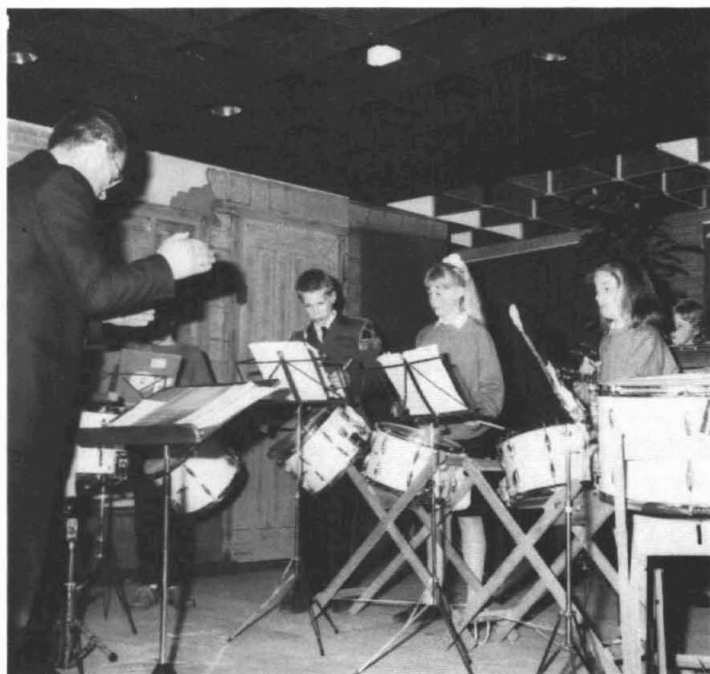
Solistenuitvoering van de Harmonie.