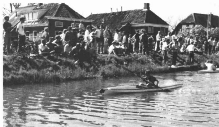
Kano varen in 't Maar.