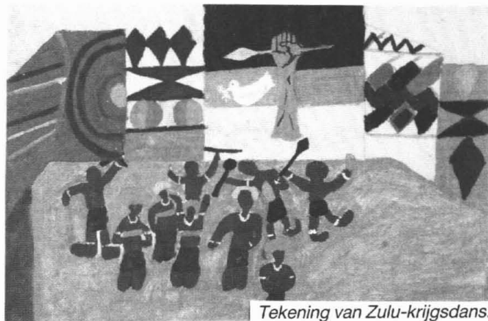
Tekening van Zulu-krijgdsdans.

"Hé Jan, hebben de burens nu alwéér een nieuwe bank?"