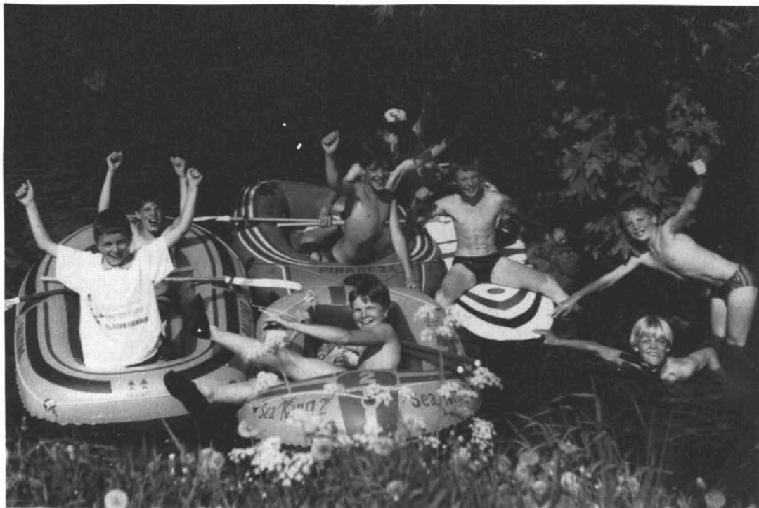
Waterpret in het Thesinger Maar.