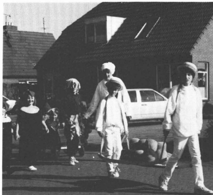
Optocht in Thesinge.