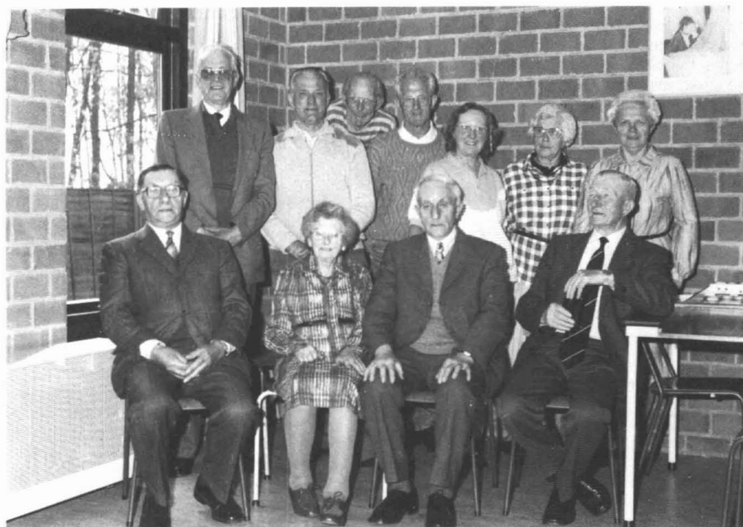
Leden bejaardensoos Garmerwolde

De heer Terpstra: we betalen f 1,- per middag, bovendien krijgen we subsidie van de Stichting Welzijn Ouderen, bv. voor het aanschaffen van nieuwe spellen. Zo hebben we eigen sjoelbakken en ook een bingospel. Als er animo zou zijn voor een ander spel, kan dat altijd. Ook kan het geld besteed worden aan vervoer. Kerkhörn huren we van