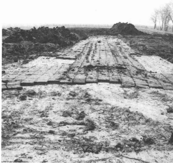
Een lege plek aan de Oude Stadsweg

Frouwke Schuur-de Vries Vrouwen-project Ten Boer 050-416394