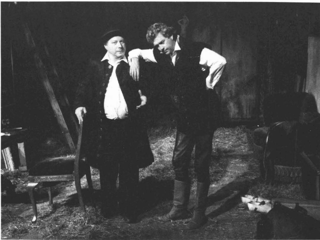
Don Juan in een schuur aan de Bovenrijgerweg