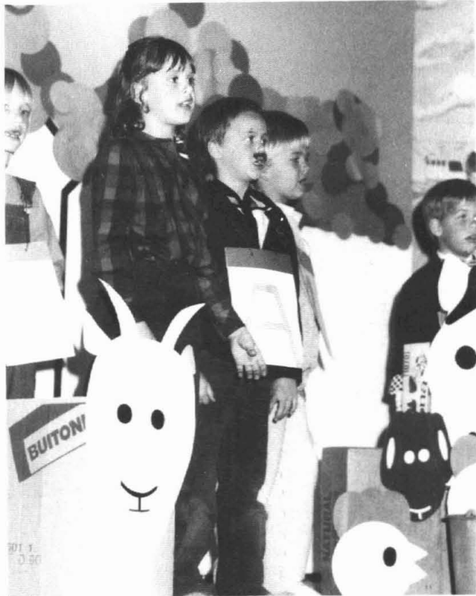
Feestelijke ouderavond van de O.B.S. Garmerwolde

In "De Letterboerderij" hadden de kinderen een stukje land gevonden waar ze zelf een kinderboerderij hadden gebouwd. Een schrijfster vond dit een goed idee en wilde er een musical over