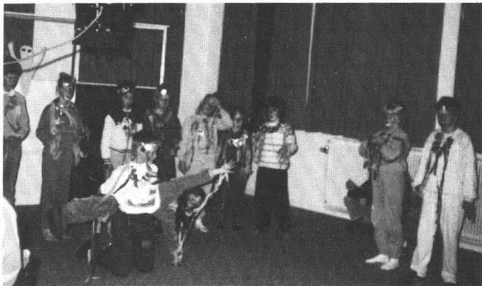
Creatieve dag in het Buurhoes te Ten Boer: de groep Beeldentuin.

Opgave: voor 7 februari bij Herbert Koekkoek , tel.: 05902-1731.