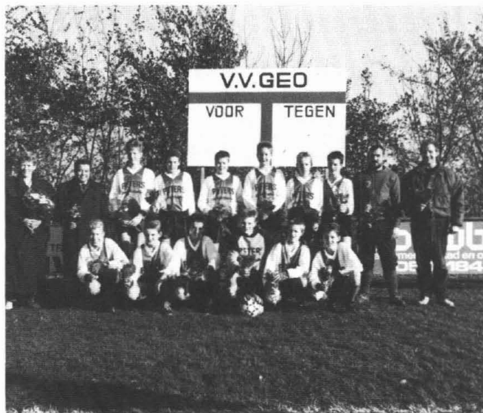
Garmerwolde: C-elftal winterkampioen

Wij zoeken iemand, die ons mee wil helpen met het verzorgen van koeien, schapen en paarden. Tel. 05902-2418.