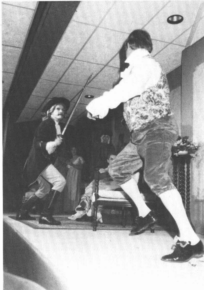
Een avond lang genieten van het toneelstuk in Garmerwolde

heel verstandig is geweest de taken strikt te verdelen hebt U tijdens de jubileumuitvoering met eigen ogen kunnen zien. Als U deze beide mensen kent zult U wel begrijpen, dat ze zich bij de repetities en de voorbereidingen zo nu en dan enorm hebben moeten beheersen om zich niet met elkaars terrein te bemoeien. Ze verdienen veel lof voor deze prestatie.