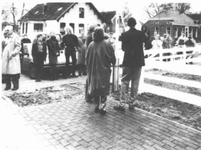
Opening Rabo-Bank Garmerwolde

Maar het werk verliep goed, ook de werkbesprekingen leverden geen problemen en we hebben het met 2 en soms 3 mensen gebouwd. Het is een zeer functioneel gebouw", aldus de heer Havenga. Het schilderwerk is