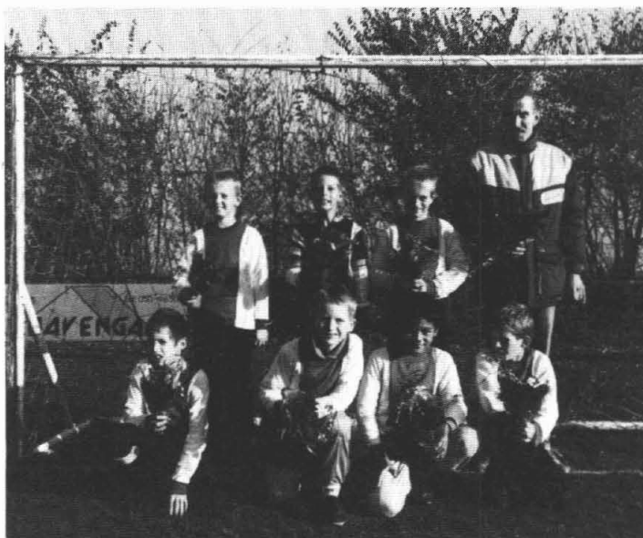
En ook deze groep werd kampioen.