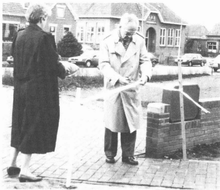
Opening Rabo-Bank Thesinge