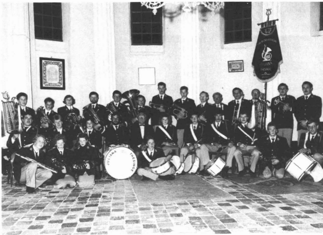
Muziekvereniging Juliana Thesinge