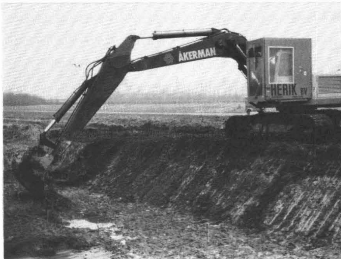
Ligt er echt een bom bij de kassen van kwekerij Veenstra?

Als leek dacht ik altijd dat er, op de plaats waar het object vermoed wordt, een groot gat gegraven wordt. Zit er niets dan wordt het gat weer dicht gegooid en wordt er