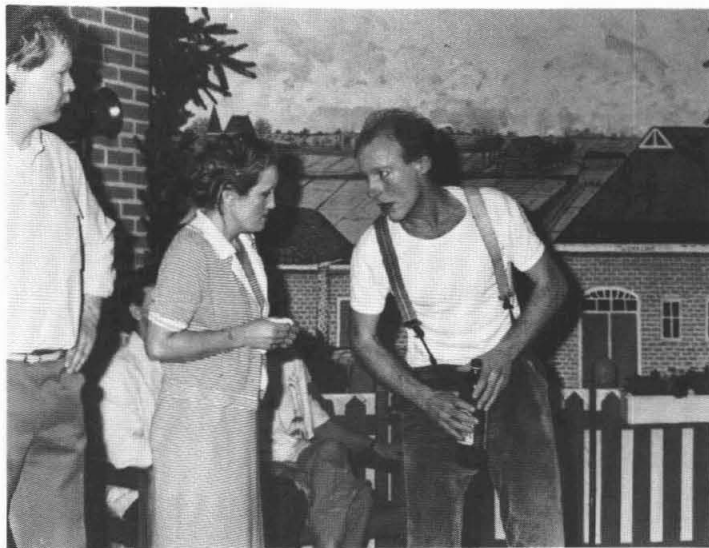
'k Wil gain knienevreet'n meer