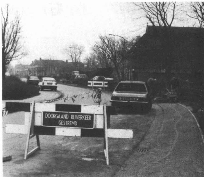
Renovatie werkzaamheden aan de Dorpsweg in Garmerwolde

De avond begint om 8 uur. Kaarten zijn verkrijgbaar vanaf 1 maart bij de Bibliotheek. Reigerstraat 2 te Ten Boer. (f 2,50).