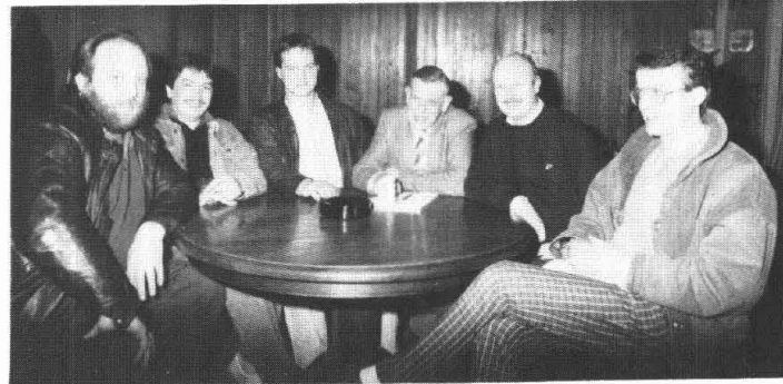
Alle heren van het oranjecomité