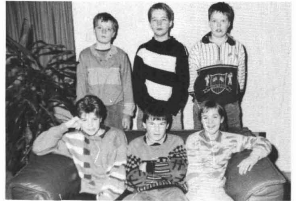
de jeugd van Thesinge"