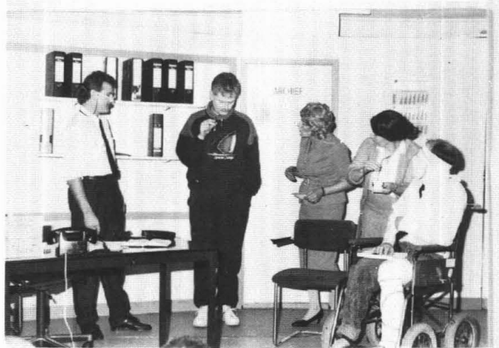
„de wethouder in de problemen”

Eigenlijk een dappere keus van gezelschap VIOD, want onderhoudend zijn met een dergelijk stuk vergt meer inzet dan met rondborstige klucht. In een vernieuwd decor kwam die inzet van het VIOD-gezelschap goed tot zijn recht.