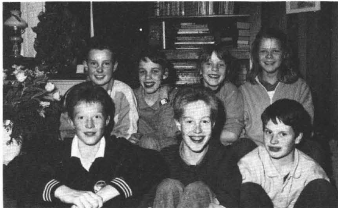
„de jeugd van Garmerwolde”

Heb je nieuwe vriend(inn)en gekregen? Zie je je oude vriend(inn)en nog wel eens?