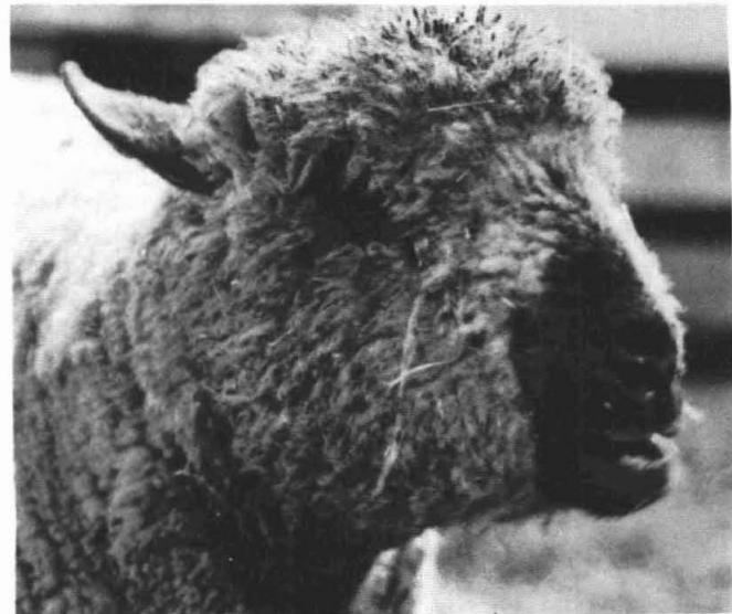
In de 60-er jaren kwamen jongens met lang haar uit Engeland. Nu zijn er ook al schapen met „Beatles haar” uit Engeland. Te zien bij Joop Blauw in Thesinge.

Kopij inleveren: steeds vóór de 15e van de maand.