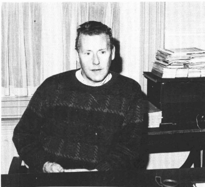
S. Folkerts

„Niet meer, ik heb er weinig aardigheid in; toespraakjes houden ligt mij niet zo. Alleen formele huwelijken, (d.w.z. alleen voor de wet trouwen, later laten bevestigen in de kerk) doe ik nog wel. Voor de andere huwelijken heeft de