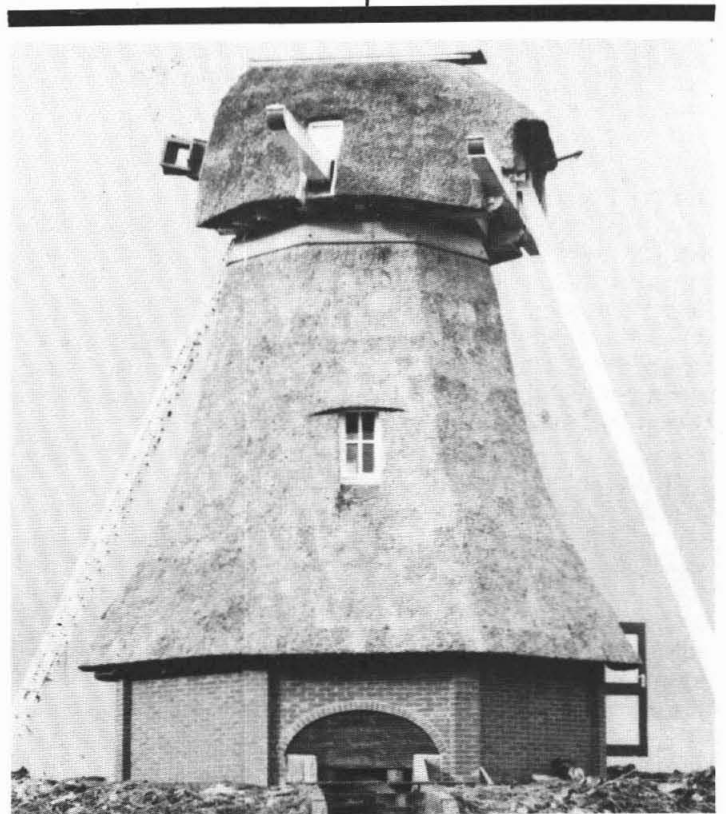
de Langelandster, bijna klaar