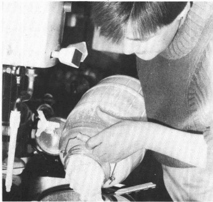
„na het karren

boterkorrels bovenin komen drijven. Na een kwartier is dit klaar en moet de boter van de rest, dit is karnemelk, worden gescheiden. Dit gebeurt in een gewone grote zeef. Er blijft plm. 2 liter karnemelk