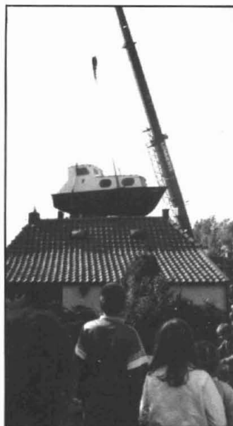
Het scheepje van Wim (Noach) Haak