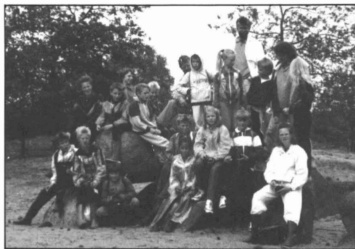
De hele groep bijeen op een hunebed

1e prijs 1443; 2e prijs 1039; 3e prijs 1199; 4e prijs 1232; 5e prijs 1496; 6e prijs 533; 7e prijs 1258; 8e prijs 1940; 9e prijs 845; 10e prijs 1553; 11e prijs 1573; 12e prijs 697; 13e prijs 999; 14e prijs 1798; 15e prijs 1559.