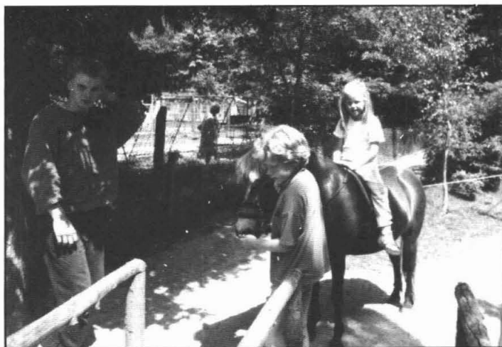
Speeltuinplezier in Drouwen