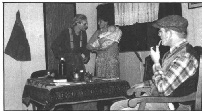
jong geleerd ...

(Prettige Kerstdagen en de beste wensen voor het nieuwe jaar 1987.)