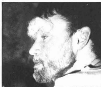
Sint "in de maak"

ik op een mooie versierde stoel met piet en zijn (haar) kadootjes en snoepgoed naast me. En toen was het ineens stil. Wat nu? Ik begreep razendsnel dat IK degene was die leven in de sinterklaasbrouwerij moest brengen. Met m'n beste sinterklaasstem zei ik iets als 'we vonden de binnenkomst zo overweldigend dat we het leuk zouden vinden als jullie nog een liedje zouden willen zingen, of niet piet?' Piet leek het ook een uitstekend idee van sinterklaas en even later werd er een lied ten gehore gebracht waarvan ik me herinner dat er op een of andere manier een pepernoot in een achterband van een fiets terecht was gekomen. Ondanks deze voor