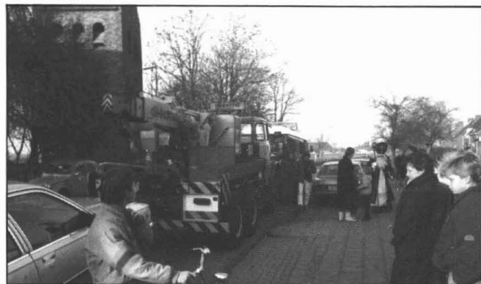
... met gillende sirenes en zwaailichten ...