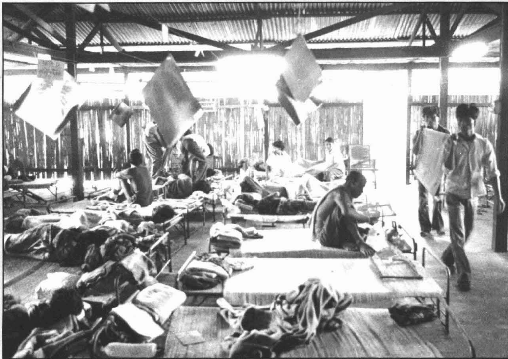
slachtoffers van het kerstoffensief

Na vele weken keihard werken kon iedereen op kerstavond in eigen stijl zijn Kerst beginnen. Voor de volgende ochtend had het Nederlandse team alle andere teams uitgenodigd voor een Kerstontbijt in de Nederlandse bungalow. Vanaf drie uur in de ochtend openden de Vietnamezen opnieuw het vuur. Heviger dan ooit leek het wel, we lagen te schudden in onze bedden. Ondanks dit geknal werd het Kerstontbijt geserveerd. De sfeer was een beetje benepen. Niet alleen om de ellende die we deze dag weer zouden zien van alle gewonden, maar zeker ook om de wrange werkelijkheid te rijmen met de kerstgedachte. Er kwamen die dag meer dan honderd ernstig gewonden van het slagveld; aan kerstmis hebben we maar niet meer gedacht.