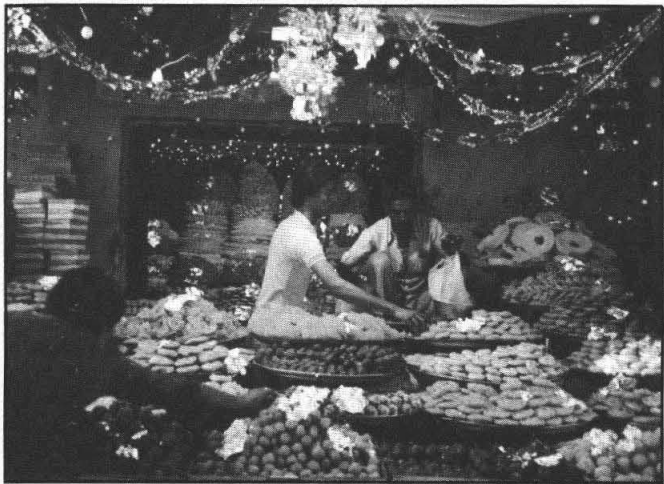
markt te Nepal

Zoveel verschilt Tihar niet van kerstmis. Dit jaar zijn we thuis met kerstmis. Dat is heel mooi, samen met familie en vrienden, maar toch ..... Kerstmis in Nepal was mooi en we zullen het missen."