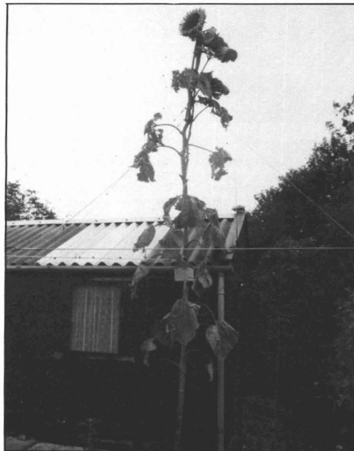
de 4.85 meter hoge zonnebloem van de fam. Harms in de Hildebrandstraat.