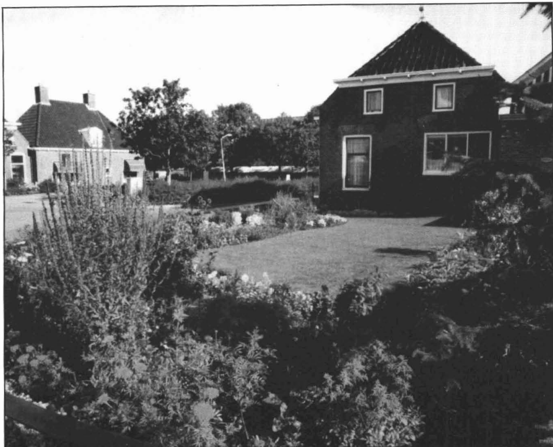
"fleurig en vrolijk, goed voor een 1 e prijs"

Vorig jaar hebben we een eerste prijs voor grote tuinen van de tuinkeuring gekregen. Leuk natuurlijk dat anderen jouw tuin ook mooi vinden. Maar daar doe ik het niet voor, zoals de mensen wel eens denken. Ik doe het puur voor mezelf. Toen we achter in de Klunder woonden lag daar net zo'n tuin als nu aan de Kapelstraat."