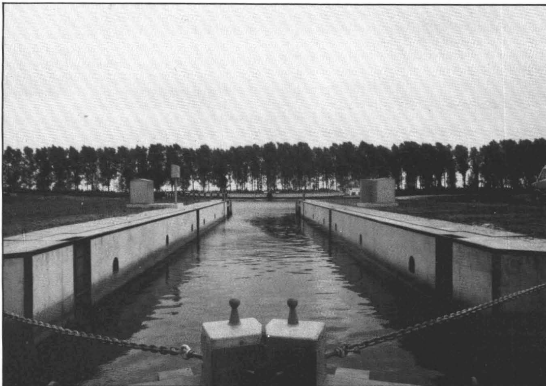
de laatste schakel in het damsterdiepcircuit

Veel mensen uit Garmerwolde en Thesinge, die regelmatig richting Groningen reizen, zullen zich ongetwijfeld wel eens afgevraagd hebben waarom het verbindingskanaal tussen het Eemskanaal en het Damsterdiep nog niet gebruikt is. Zo te zien is alles gereed. Daarom Provinciale Waterstaat, die het complex onder beheer hebben, opgebeld en enige vragen gesteld. Aan de heer Bergeres, die over de onderbouw en de betonconstructie gaat, is de volgende vraag gesteld. Is het waar dat het water uit het verbindingskanaal gezogen wordt als er een boot met veel tonnage door het Eemskanaal vaart en levert dit gevaar op voor de pleziervaart?