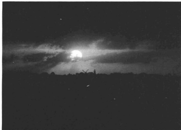
"als deze lichtbron weg is, wordt het wel heel erg donker in Thesinge en Garmerwolde"