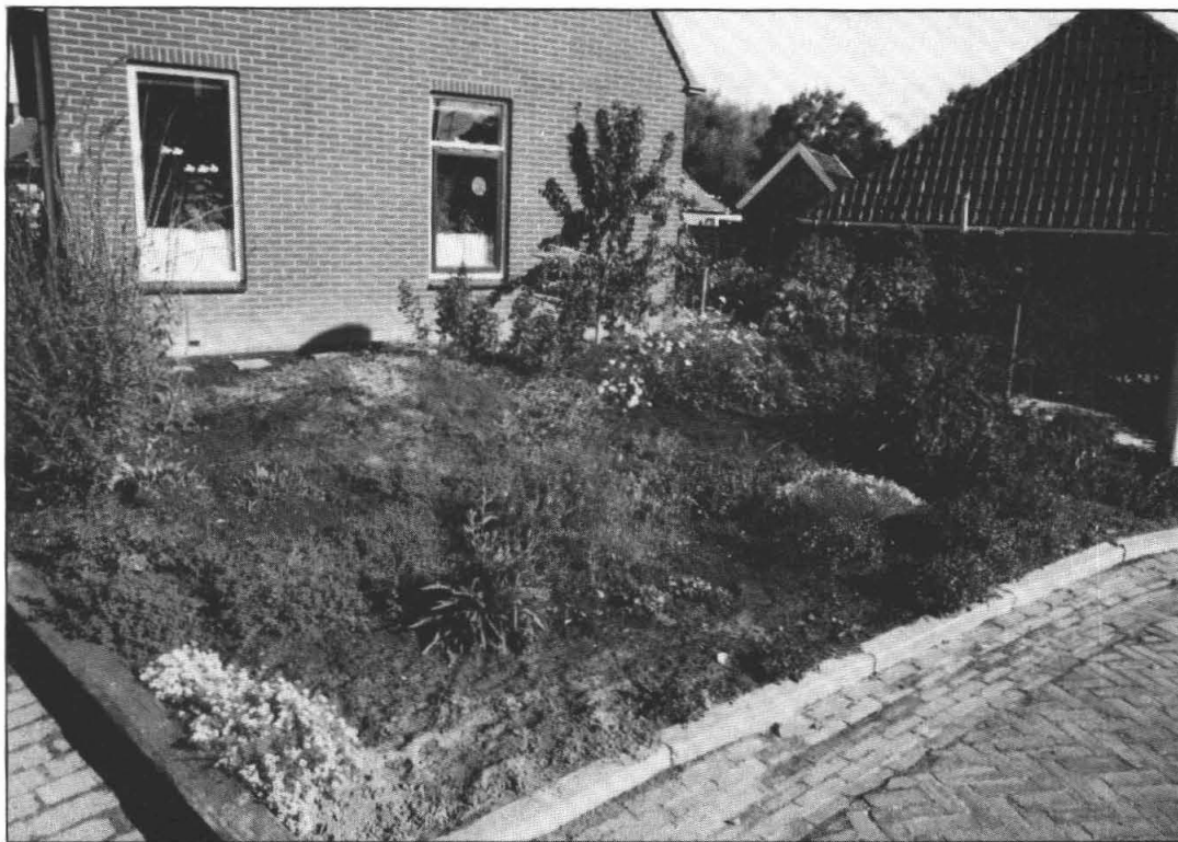
"de kruidentuin van de fam. Hofstra"

milieu's (b.v. kleigrond, zandgrond, e.d.) een kans te geven maakten we een zandheuveltje en een laagte met wat turfstrooi- sel.