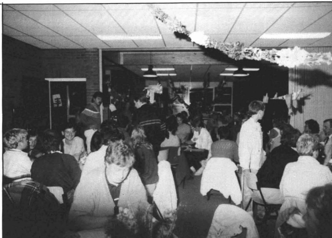
een gezellige drukte

Besloten was de jaarlijkse Floralia eens in een ander jasje te steken, vooral de avonduurtjes gaven een ander beeld te zien dan de voorgaande jaren, nl. een grote bingo met uiteraard prachtige prijzen, die het talrijke publiek met rode wangen deed strepen en kruisen.