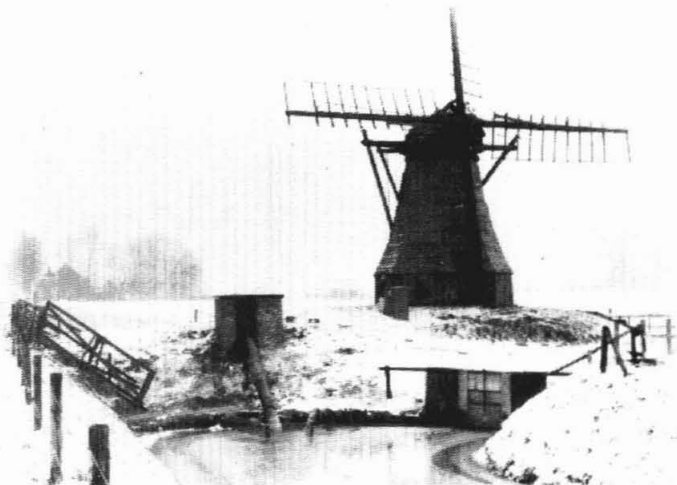
De Langelandster watermolen