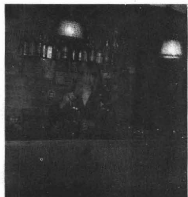
Altijd lachende Ria

Breed-grijskend bekennt Ria: 'Ook bij tegenvallers is mijn eerste reactie om de lachspieren maar eens lekker te laten werken. Je moet je nooit laten overbluffen. Er zitten hier heus weleens mopperaars, ook over de gang van zaken hier. . . dan knik ik maar lachend en iedere keer zitten ze wéér hier! Dan valt het met die klachten ook wel mee. Nee hoor, ik zie het echt niet snel somber in. . .' Een positieve instelling, waarmee Ria het best rootit.