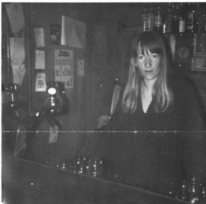
Als het moet, kan ze ook weleens ernstig

In het begin kwam er hoofdzakelijk jeugd op het café af. 'Dat zat 'm natuurlijk in die disco-avonden. De eerste tijd ging dat heel leuk, maar op den duur kregen we zulke toestanden van de Lewenborgers tegenover de Ten Boersters. Dan moesten we de hele avond min of meer voor oppassertjes spelen. Als het binnen dan gemoedelijk bleef, ging de herrie op straat gewoon door. Dat was voor het dorp ook