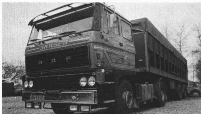
Geweideweg 11 - Garmerwolde. Speciaal voor vervoer van consumptie aardappelen en los gestorte granen. Tel. 050-416365