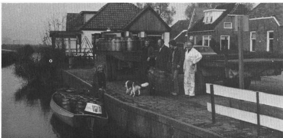
Gezelligheid in de melkhaven . . .